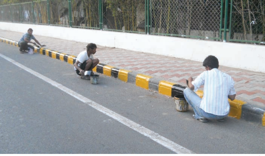
રાષ્ટ્રપતિના સ્વાગતની તૈયારી : આગામી સપ્તાહમાં ભારતના રાષ્ટ્રપતિ અમદાવાદ-ગાંધીનગર આવી રહ્યા છે. ત્યારે શહેરના માર્ગોને સજાવઈ રહ્યા છે. ફૂટપાથને સ્વચ્છ કરી નવા રંગોથી સજી રહી છે.