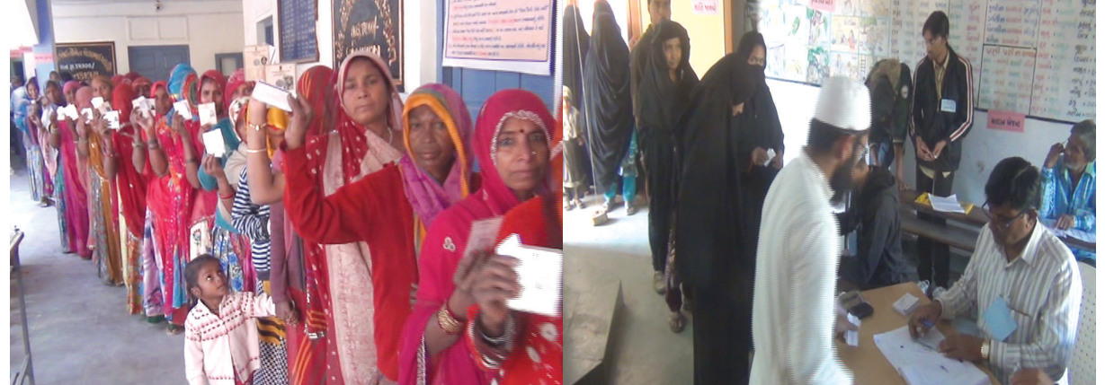
બનાસકાંઠામાં પાલનપુરમાં તેમજ ડીસામાં સવારથી જ મતદારોમાં અનોખા ઉત્સાહ જોવા મળ્યો હતો. સવારે ૨ કલાકમાં ૮ ટકા મતદાન નોંધાયો હતો. ત્યારબાદ બપોર સુધીમાં ૨૫.૮૭ ટકા મતદાન નોંધાયું હતું જે સોંજ સુધીમાં પાલનપુરમાં અંદાજીત ૫૮ ટકા તેમજ ડીસામાં ૬૨ ટકા થવાનો અંદાજ લગાયો છે.