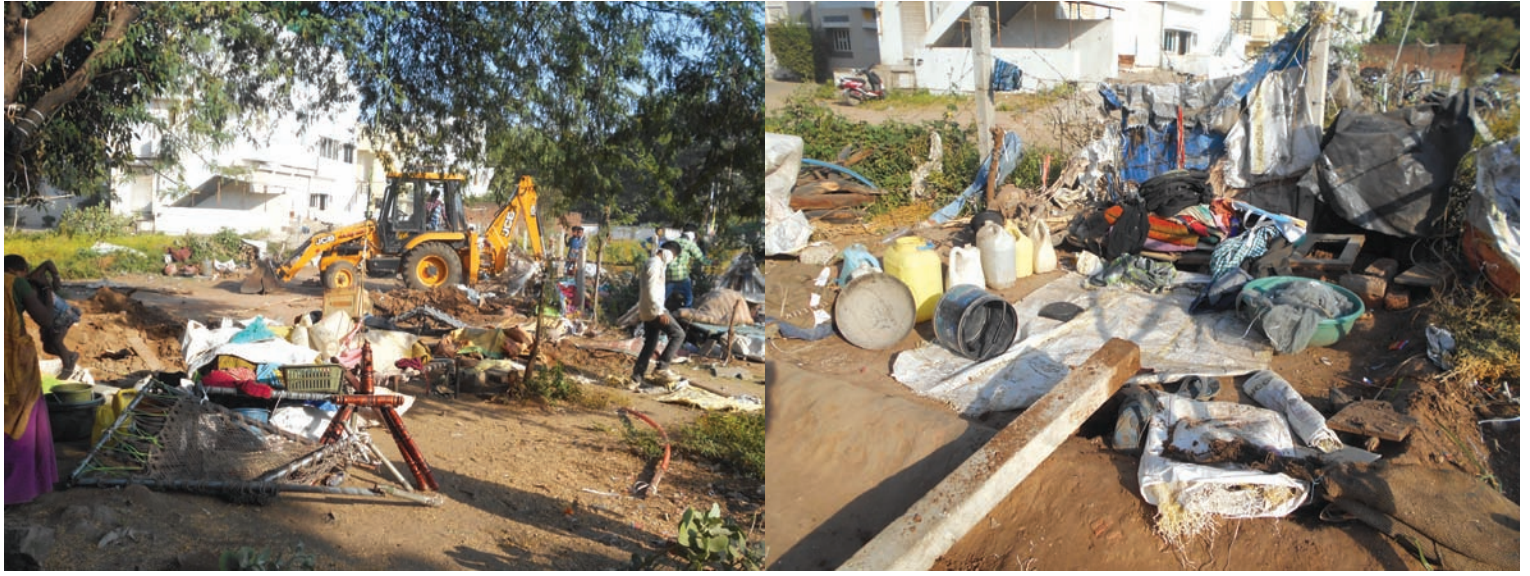
દબાણ - શહેરમાં આજકાલ દબાણ હટાવો ઝુંબેશ વેગ પકડી રહી છે... સેક્ટર-૭માં ગેરકાયદેસર ઝૂંપડાઓ તથા બાંધકામના દબાણો હટાવવાયા હતા... દબાણ મુક્ત ગાંધીનગર અભિયાનને સાનુકૂળ પ્રતિસાદ સાંપડી રહ્યો છે... આમ છતાં કેટલો સમય દબાણો યથાવત નથી બનતા એ પણ એક ચર્ચાનો વિષય છે...

ગાંધીનગર, તા. ૧૧ લગ્નસરાની મોસમ હવે શરૂ થઈ છે. આજે દેવઉઠી અગિયારસથી જ લગ્નોનો પ્રારંભ થઈ ચુક્યો છે. આજે પ્રથમ દિવસે જ શહેરમાં ઘણા લગ્નો યોજાયા હતા. શહેરમાં હવે લગ્નોની સિઝન શરૂ થઈ છે. દેવપોઠી અગિયારસથી બંધ થયેલા શુભકાર્યો અને લગ્નો હવે ચાર માસના અંતરાલ બાદ પુનઃ શરૂ થયા છે. આજે દેવ ઉઠી અગિયારસથી જ ઢોલ ધ્રબુકવા શરૂ થઈ ગયા છે. આજે શહેરમાં ઘણા લગ્નો યોજાયા હતા. ગઈરત્રે ગરબા યોજાતા વાતાવરણમાં જીવંતા આવી ગઈ હતી. શહેરની લગ્નવાડીઓ, હોલ અને આસપાસ આવેલા મોટાભાગના પાર્ટીહોલ્સ લગ્નોના કારણે બુક રહ્યા હતા. ભોજન સમારંભો અને લગ્નમાં હાજરી આપનારાઓ આજે સજીવજીવે ફરતા જોવા મળ્યા હતા. હજુ એકાદ દોઢ મહિનો લગ્નના સારા મુહૂર્ત હોઈ આ સમયગાળા દરમ્યાન ઘણા લગ્નો અને રીસેપ્શન યોજાશે.