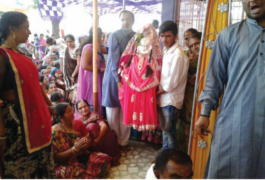
તુલસી વિવાહ - દેવઉઠી અગિયારસના પાવન પર્વે મંદિરોમાં તુલસી વિવાહ ધામધૂમથી ઉજવાય છે... અગિયારસ બાદ શુભવિવાહના મુહૂર્તનો પ્રારંભ તુલસીના વિવાહથી થાય છે... જિલ્લાના દરેલા ગામે તુલસી વિવાહનો કાર્યક્રમ ભાવપૂર્વક યોજાયો હતો...