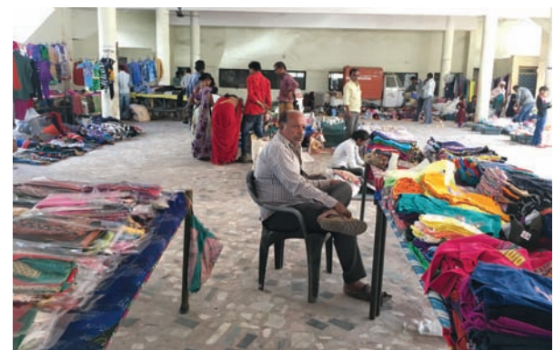
મોડાસાની રવિવારી બજારમાં રૂ. ૫૦૦ અને ૧૦૦૦ની નોટ બંધ થવાથી કાગડ ઉડ્યા

અરવલ્લી જિલ્લાના મુખ્યમથક મોડાસા શહેરના મુખ્યમાર્ગ અને ચાર રસ્તા નજીક આવેલા નગર સેવા સદનના ભોંયતળીયામાં ભરાતી રવિવારી બજારમાં ધરાકીને જાણે સાપ સુંઘી ગયો હોય તેવો માહોલ જોવા મળ્યો હતો. મોડાસાની રવિવારી બજારમાં જિલ્લાના તેમજ તાલુકાના ગામડાઓમાંથી ગરીબ વર્ગ અને મધ્યમ વર્ગીય લોકો તેમજ શહેરીજનો મોટી સંખ્યામાં સસ્તા ભાવે ચીજવસ્તુઓ અને કપડા ખરીદવા ઉમટી પડે છે. પરંતુ એકાએક કેન્દ્ર સરકાર અને દેશના વડાપ્રધાન નરેન્દ્ર મોદી દ્વારા મંગળવારે રાત્રીએ ૮ વાગ્યાના સુમારે રૂ. ૫૦૦ અને રૂ. ૧૦૦૦ની નોટ બંધ થવાની સાથે જ પ્રજાજનો અને વેપારી વર્ગની હાલત કફોડી બની હતી. પ્રજાજનો પાસે ધન તો છે પરંતુ નકામી નોટો બની જતા અને વેપારીવર્ગ દ્વારા રૂ. ૫૦૦ અને રૂ. ૧૦૦૦ની નોટ ખરીદવાનો ઈનકાર કરતા મંદીની મહોર લાગી ગઈ છે. રવિવારી બજારમાં પથારી નાખીને બેસતા એક વેપારીના જણાવ્યા અનુસાર દર રવિવારે મોડાસામાં રૂ. ૧૫૦૦થી વધુનો વકરો થતો હોય છે અને અત્યારે દિવાળી વેકેશનના પગલે ખરીદી વધવાની સંભાવનાના પગલે વધુ માલ-સામાન અને કપડાની ખરીદી કર્યા બાદ રૂ. ૫૦૦ અને રૂ. ૧૦૦૦ બંધ થવાથી ધરાકી ન થતા જીવન નિર્વાહ ચલાવવો મુશ્કેલી પેદા થઈ છે. સવારથી અત્યાર સુધી રવિવારીમાં કરફુ જોવો માહોલ જોવા મળી રહ્યો છે.