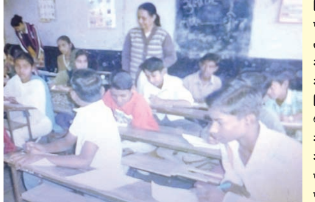
ગાંધીનગર, તા. ૧૯ સરકારી પ્રાથમિક શાળા, સેક્ટર-૨૮/૧ ખાતે ગુજરાત રાજ્ય

બાળ સંરક્ષણ આયોગ દ્વારા એક કસોટીનું આયોજન કરવામાં આવ્યું હતું, જેમાં ધોરણ-૮ના ૨૦