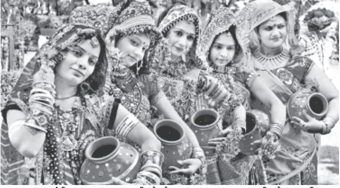
ગાંધીનગર, તા. ૬ નવરાત્રી એટલે સતત નવ-નવ ગુજરાતની ઓળખ બની ચુક્યા દિવસ સુધી ગરબે ધુમવાનો અવસર. નવરાત્રી અને ગરબાએ અને દશરાત્રી ઉજવણી થાય છે

ગુજરાતમાં નવરાત્રી એટલે ઉપાસનાના પર્વની સાથે જ ગરબે ધુમવુ પરંતુ