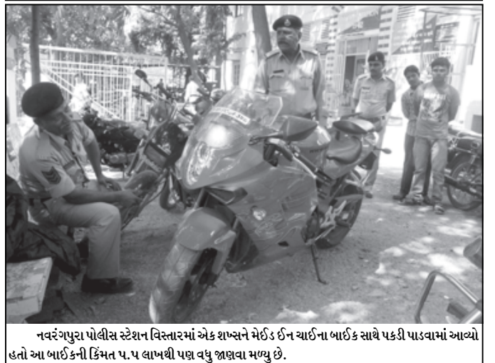
નવરંગપુરા પોલીસ સ્ટેશન વિસ્તારમાં એક શખ્સને મેઈડ ઈન ચાર્જના બાઈક સાથે પકડી પાડવામાં આવ્યો હતો આ બાઈકની કિંમત ૫.૫ લાખથી વધુ વધુ જણવા મળ્યું છે.

પ્રભાસ પાટણમાં મકાન ધરાશાયી : એકનું મોત વેરાવળ, તા. ૨૬ પ્રભાસ પાટણમાં વેરાવળ શહેરમાં ત્રણ માળના મકાનની છત ધરાશાયી થતાં એક બાળકનું મોત જ્યારે પાંચ લોકોને ઈજા થવા પામી છે.