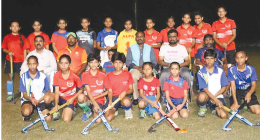
રાજ્ય કક્ષાએ રેમિથિંગ બનાવતાં હોકી ટીમના સભ્યોને શુભકામનાઓ પાઠવતાં કલેક્ટર

અમીરગઢ તાલુકા ના ખારી ગામ ના ૪૬ જેટલા આદિવાસીઓની જમીન મામલો વધુ ગરમાયો છે. વન વિભાગ દ્વારા જમીન ખાલી કરાવવા સહિતની કથિત કનડગત ને લઈને આજે પાલનપુર ખાતે આદિવાસીઓએ રેલી યોજી કલેક્ટરને આવેદનપત્ર આપી ન્યાયની ગુહાર લગાવી હતી. અમીરગઢ તાલુકાના ખારી ગામના અસરગ્રસ્ત આદિવાસીઓ દ્વારા અપાયેલ આવેદનપત્રમાં જણાવ્યા મુજબ, ખારી ગામના ૪૬ જેટલા આદિવાસી પરિવારો ના કબજા ભોગવવાવાળી જમીન પર રહેલા ઘર અને ઉભા પાક પર જેસીબી મશીન ફેરવી તોડફોડ કરી વન વિભાગ દ્વારા ભારે નુકસાન કરાયું છે. વન વિભાગ દ્વારા નોટીસો આપ્યા વિના જમીન ખાલી કરાવી હતી. ત્યારે અવારનવારની રજૂઆતો છતાં પગલાં ભરાયા નથી. દરમિયાન, વન વિભાગની કથિત રજા સામે આજે આદિવાસીઓ પાલનપુર દોડી આવ્યા હતા. જ્યાં તેઓએ પાલનપુરના જુના આર.ટી.ઓ. સર્કલથી કલેક્ટર કચેરી સુધી રેલી યોજી હતી. જે રેલી કલેક્ટર કચેરીએ પહોંચી હતી. જ્યાં આવેદનપત્ર આપી ન્યાયની ગુહાર લગાવી હતી. જેમાં વન વિભાગની કથિત કનડગત સામે આગામી સમયમાં કોઈ આદિવાસી આપઘાત કરશે તો તેની સમગ્ર જવાબદારી તંત્રની રહેશે તેવી ચીમકી ઉચ્ચારવામાં આવી હતી. દરમિયાન, અસરગ્રસ્તોએ ન્યાય નહીં મળે ત્યાં સુધી કલેક્ટર કચેરીથી ઉભા નહિ થવાની ચીમકી આપતા ચક્રવાર મચી જવા પામી છે.