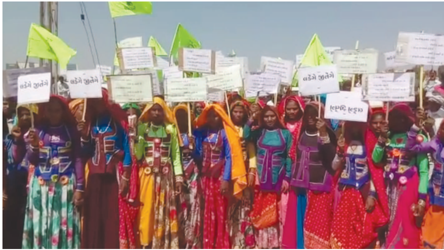
ખારી ગામના આદિવાસીઓએ ન્યાય માટે યોજી રેલી

દેશના શ્રેષ્ઠ ગામ તરીકેનું બિરુદ મેળવનાર ગુજરાતના સાબરકાંઠા જિલ્લાના પુંસરી ગામની ૫૭ દેશના ૧૩૮ ડેલીગેટ્સનું ઉચ્ચકક્ષાનું પ્રતિનિધિ મંડળે રવિવારે મુલાકાત લીધી હતી. "વૃક્ષ વાવો પર્યાવરણ બચાવો" અંતર્ગત પ્રભારી સચિવ જ્યંતી રવિની ઉપસ્થિતિમાં ૫૭ દેશના ડેલીગેટ્સ દ્વારા પુંસરી ગામમાં વિવિધ જગ્યાએ વૃક્ષારોપણ કર્યું હતું. વૃક્ષારોપણ કાર્યક્રમમાં સાંસદ સભ્યો, ધારાસભ્યો, જીલ્લા કલેક્ટર, જીલ્લા વિકાસ અધિકારી અને સાબરકાંઠા વનવિભાગના અધિકારીઓ અને કર્મચારીઓ હાજર રહ્યા હતા.