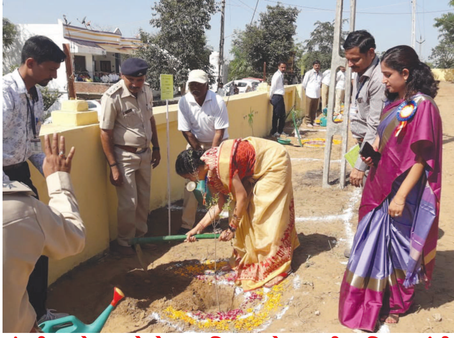
પુંસરી ગામે ૫૭ દેશોના સચિવ અને પ્રભારી સચિવ જ્યંતી રવિએ વૃક્ષારોપણ કર્યું

દેશના શ્રેષ્ઠ ગામ તરીકેનું બિરુદ મેળવનાર ગુજરાતના સાબરકાંઠા જિલ્લાના પુંસરી ગામની ૫૭ દેશના ૧૩૮ ડેલીગેટ્સનું ઉચ્ચકક્ષાનું પ્રતિનિધિ મંડળે રવિવારે મુલાકાત લીધી હતી. "વૃક્ષ વાવો પર્યાવરણ બચાવો" અંતર્ગત પ્રભારી સચિવ જ્યંતી રવિની ઉપસ્થિતિમાં ૫૭ દેશના ડેલીગેટ્સ દ્વારા પુંસરી ગામમાં વિવિધ જગ્યાએ વૃક્ષારોપણ કર્યું હતું. વૃક્ષારોપણ કાર્યક્રમમાં સાંસદ સભ્યો, ધારાસભ્યો, જીલ્લા કલેક્ટર, જીલ્લા વિકાસ અધિકારી અને સાબરકાંઠા વનવિભાગના અધિકારીઓ અને કર્મચારીઓ હાજર રહ્યા હતા.