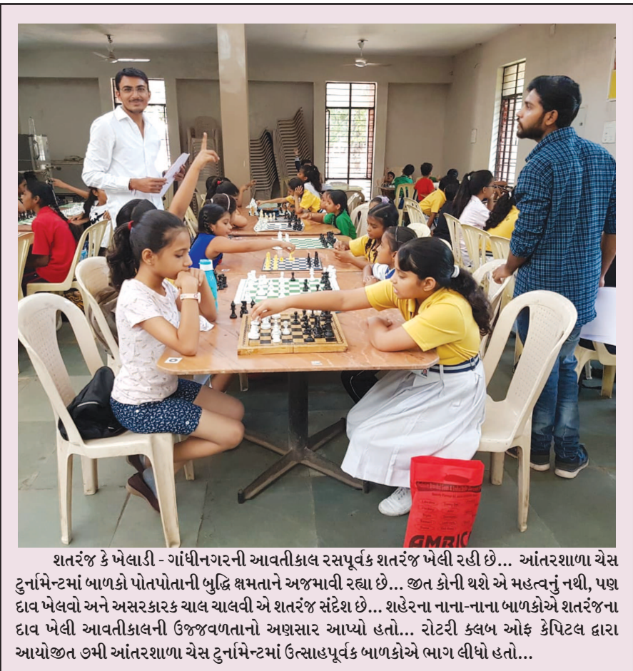
શતરંજ કે ખેલાડી - ગાંધીનગરની આવતીકાલ રસપૂર્વક શતરંજ ખેલી રહી છે... આંતરશાળા ચેસ ટુર્નામેન્ટમાં બાળકો પોતપોતાની બુદ્ધિ ક્ષમતાને અજમાવી રહ્યા છે... જીત કોની થશે એ મહત્વનું નથી, પણ દાવ ખેલવો અને અસરકારક ચાલ ચાલવી એ શતરંજ સંદેશ છે... શહેરના નાના-નાના બાળકોએ શતરંજના દાવ ખેલી આવતીકાલની ઉજવણીના તો અણસાર આપ્યો હતો... રોટરી ક્લબ ઓફ કેપિટલ દ્વારા આયોજીત ૭મી આંતરશાળા ચેસ ટુર્નામેન્ટમાં ઉત્સાહપૂર્વક બાળકોએ ભાગ લીધો હતો...