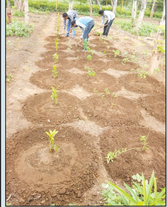
કસેરી રંગના ફુલો નિખરશે. વનતંત્ર દ્વારા ઘ અને ચ માર્ગની આસપાસ સ્થિત વન આરક્ષિત જગ્યામાં ચાર લાઈનમાં આ પ્રકારે કલરકોડ પ્રમાણે રોપાઓની વાવણી કરી દેવામાં આવી છે. ● અનુસંધાન પાન-૭ પર

જેમાં વન આરક્ષિત જગ્યાની સફાઈ તેમજ ફેન્સીંગને યોગ્ય કરવા સહીત આસપાસ રંગબેરંગી ફુલો નિખરતા મુખ્યમાર્ગોની રોનક નિખરશે.