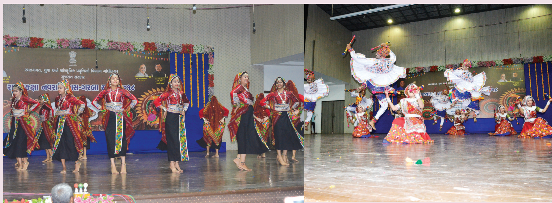
નવરાત્રી રાસ-ગરબા સ્પર્ધા - ગાંધીનગરને આંગણે રાજ્યકક્ષાની રાસ-ગરબા સ્પર્ધાનો ધમાકેદાર પ્રારંભ થયો હતો... રાજ્યના ૧૨૧ કલાવૃદ્ધો આ સ્પર્ધામાં ભાગ લઈ રહ્યા છે... એક-એકથી યડિયાતા ગરબા ગુપો અને રાસ મંડળીઓ ચાર દિવસ ગાંધીનગરનો મધ્ય ગજવશે... રાજ્યકક્ષાની ઉત્કૃષ્ટ કલામંડળીઓને માણવાનો ગાંધીનગરનો પુરતા પ્રમાણમાં મોકો નહિ મળે એનો ગણગણાટ પણ શહેરમાં સંભળતો હતો...