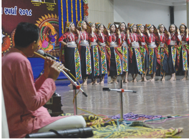
રાસ-ગરબાનો રસથાળ - નવરાત્રીના આગમનની સાથે નગરમાં નવરાત્રીનો માહોલ જામ્યો છે... ગાંધીનગર ખાતે બે દિવસથી ચાલી રહેલી રાજ્યકક્ષાની નવરાત્રી રાસ-ગરબા સ્પર્ધામાં બીજા દિવસે પણ વિવિધ વિસ્તારોની રાસ-ગરબા મંડળીઓ અદ્ભુત કૃતિઓ રજૂ કરી હતી. રાસ-ગરબા સ્પર્ધામાં દરરોજ અવાંચીન-પ્રાચીન અને રાસની કૃતિઓ રજૂ થાય છે...

ગુજરાતના પ્રતિનિધિ મંડળે યુ.એસ સ્થિત વોશિંગ્ટન ડી.સી.માં વિશ્વ બેંક અને આઈએમએફના અધિકારીઓની મુલાકાત લીધી યુ.એસ.-ઈન્ડિયા સ્ટ્રેટેજિક પાર્ટનરશિપ ફોરમ (યુએસઆઈએસપીએફ) દ્વારા 'વાયબ્રન્ટ ગુજરાત - શોપિંગ અન્ડ ઈન્ડિયા' વિષય પર મહાત્મા ગાંધીજીની ૧૫૦મી જન્મજયંતીના દિવસે વિશેષ સેમિનારનું આયોજન કરવામાં આવ્યું હતું. આ સેમીનારમાં રાજ્ય સરકારના નાણાં વિભાગના અધિક મુખ્ય સચિવ અરવિંદ અગ્રવાલ સહિતનું પ્રતિનિધિ મંડળ ઉપસ્થિત રહ્યું હતું. જેમાં 'શોપિંગ અન્ડ ઈન્ડિયા' વિષય પર વિવિધ ટ્રિફિકોણ વિશે ચર્ચા-વિચારણા કરવામાં આવી હતી તેમજ નીતિ નિર્માતાઓ અને ભવ્ય ભારતના નિર્માણમાં મહાત્મા ગાંધીની જન્મભૂમિ ગુજરાત હું ભૂમિકા ભજવે છે તે અંગે ચર્ચા કરવામાં આવી હતી. આ પ્રસંગે નિમિત્તે એએસેડર કાલાં હિલ્સે કહ્યું હતું કે, ભારતને આર્થિક રીતે સદ્ગર બનાવવામાં ગુજરાતનું યોગદાન અમૂલ્ય છે. જેમાં ગુજરાતના પૂર્વ મુખ્યમંત્રી અને હાલના દેશના પ્રધાનમંત્રી નરેન્દ્ર મોદી દ્વારા શરૂ કરવામાં આવેલી વાયબ્રન્ટ ગુજરાત સમિતિ ગુજરાતની આર્થિક સફળતાનું મુખ્ય કારણ છે.