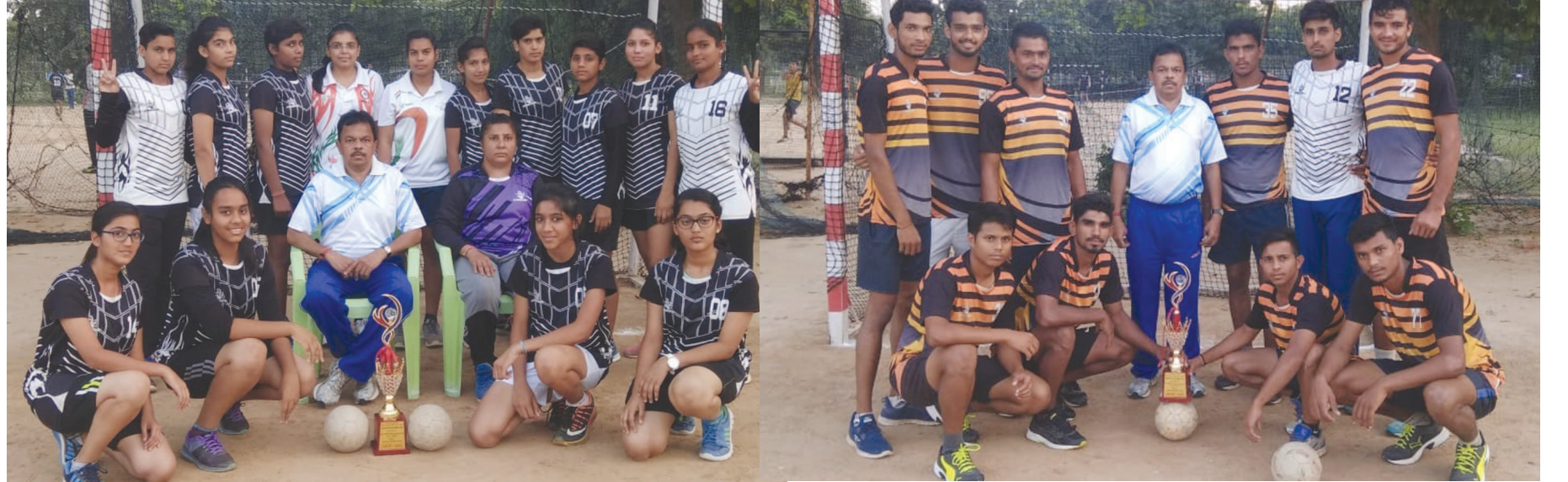
સાઈની અન્ડર-૧૯ હેન્ડબોલ ટીમો ચેમ્પિયન

ગાંધીનગર, તા.૫ સાબરકાંઠા જિલ્લાના હિંમતનગર તાલુકાના હુંદર ગામે તાજેતરમાં એક ફેક્ટરીમાં કામ કરતા પરપ્રાંતિય મજૂરે એક ૧૪ માસની ટિકરી પર દુધ્ધમ ગુજરી અવાવરૂ જગ્યાએ ફેંકી દીધી હતી. દુધ્ધમ કરનાર યુવાન નાસી ગયો હતો પરંતુ પોલીસની સત્કર્તાથી તે પકડાઈ ગયો હતો. પરપ્રાંતિય યુવાન દ્વારા આચરવામાં આવેલા અત્યાચારના પડઘા સમગ્ર ગુજરાતમાં પડ્યા છે. જેથી આગામી દિવસોમાં આ પ્રકારની ઘટના ન બને તે માટે ગાંધીનગર જિલ્લા ઠાકોર સેના દ્વારા ગાંધીનગર શહેરી-ગ્રામ્ય વિસ્તારમાં વસવાટ કરતા પરપ્રાંતિયોને ઘર છોડી જવા માટે ૪૮ કલાકનું અલ્ટીમેટમ આપવામાં આવ્યું છે. જ્યારે વાવોલ શ્રમિક ઠાકોર સેના અને ગ્રામજનો દ્વારા ગ્રામ પંચાયતને આવેદન પત્ર આપવામાં આવ્યું છે. તાજેતરમાં હિંમતનગર તાલુકાના હુંદર ગામે બનેલી દુધ્ધમની ઘટનાના પડઘા સમગ્ર ગુજરાતમાં પડ્યા છે. ત્યારે આરોપીને કડકમાં કડક સજા થાય તે માટે ઠેરઠેર ઠાકોર સેના દ્વારા તંત્રને આવેદન પત્ર આપવામાં આવ્યા છે, તો બીજી તરફ સમગ્ર ગુજરાતના નાગરીકો દ્વારા શહેરી વિસ્તાર સહિત જિલ્લા-તાલુકા કક્ષાએ કેન્ડલ માર્ચ યોજીને આરોપીને કાંસીની સજાની માંગ કરી રહ્યા છે. ત્યારે ગુજરાત શ્રમિક ઠાકોર સેનાના કાર્યકરોએ શહેરના સેક્ટર-૧૫ ફતેપુરા, સે-૨૪, ઈન્દ્રોડા, બોરીજ, આદિવાડા, વાવોલ, ઉવારસદ, સહિતના વિસ્તારોમાં વસવાટ કરતા અને વેપાર-રોજગાર અને મજૂરી કામ કરતા પરપ્રાંતિય નાગરીકોને ઘર છોડી જવા માટે ઠાકોર સેના અને ગ્રામજનો દ્વારા ગ્રામ પંચાયત ખાતે આવેદન પત્ર પાઠવી રજૂઆત કરી હતી. જ્યારે ૪૮ કલાકના અલ્ટીમેટમને પગલે પરપ્રાંતિયોમાં પણ ભયનો માહોલ પ્રસરી જવા પામ્યો છે.