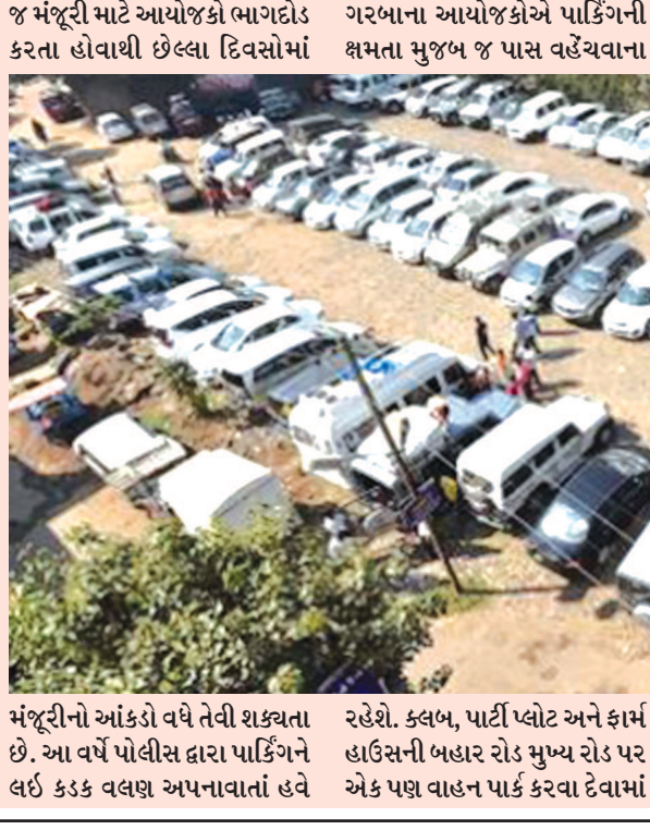
મંજૂરીનો આંકડો વધે તેવી શક્યતા છે. આ વર્ષે પોલીસ દ્વારા પાર્કિંગને લઈ કડક વલણ અપનાવાતાં હવે

ગાંધીનગર, તા.૫ શહેરની કલબ, પાર્ટી પ્લોટ અને ફાર્મ હાઉસમાં ગરબા રમવા જવા ઈચ્છતા ખેલેલાઓ અને યુવાવર્ગ પોતાના વાહનોના પાર્કિંગની ચિંતા કરવી પડશે, કારણ કે આ વર્ષે પાર્કિંગના મુદ્દે પોલીસનું કડક વલણ હોવાથી દરેક ગરબાના આયોજકને પોલીસે પાર્કિંગની જેટલી વ્યવસ્થા હોય તેટલા જ પાસ વહેંચવા માટે સૂચના જારી કરાઈ છે. એટલું જ નહીં, ટ્રાફિક અને પાર્કિંગના મુદ્દે પોલીસનું વલણ આકરું હોવાના કારણે ગરબા આયોજકોના આયોજનમાં પણ જાણે આ વખતે ભંગ પડ્યો છે. જેને લઈ આ વર્ષે ટ્રાફિક-પાર્કિંગ, સીસીટીવી કેમેરા અને સલામતી-સુરક્ષાના મુદ્દાઓને લઈ આ વખતે ગરબાની મંજૂરી માટેની અરજીઓમાં નોંધપાત્ર ઘટાડો નોંધાયો છે. હજુ સુધી માત્ર ૨૫થી વધુ કિસ્સામાં