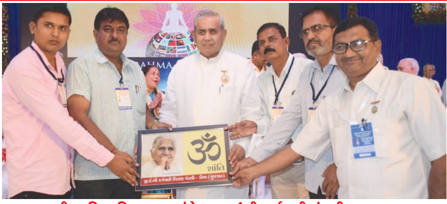
બ્રહ્માકુમારીના વિશ્વ શિખર મહાસંમેલન જીવંતી કર્મચારી મંડળી દ્વારા સન્માન

ટાટની ગુજરાતી માધ્યમની તમામ વિષયોની પરીક્ષા મોબાઈલમાં પેપર લીક કરી કેટલાક લેભાગુ સખ્સોએ કોભાંડ આચરતા પરીક્ષા રદ થતા હજારો વિદ્યાર્થીઓના સમય અને નાણા વ્યર્થ જતા અને ફરીથી સમય અને નાણા બગાડવાની નોબત આવતા પરીક્ષા બોર્ડની ઘોર બેદરકારી સામે ભારે રોષ ફેલાયો હતો અને કોભાંડમાં સંડોવાયેલા મગરમચ્છો છટકી ન જવા જોઈએની માંગ સાથે હાલમાં નોંધાયેલ ફરિયાદમાં આરોપી તો તળાવની નાની માછલી હોવાનું જણાવ્યું હતું. વોટ્સઅપ મેસેજથી ફરતું કરી પેપર લીક કરી વિશ્વાસઘાત છેતરપિંડી ઠગાઈ કરવામાં આવી હોવાની ફરિયાદ નોંધાવતા જીલ્લા પોલીસવડા મયુર પાટિલે સમગ્ર કેસની તપાસ જીલ્લા એલસીબી