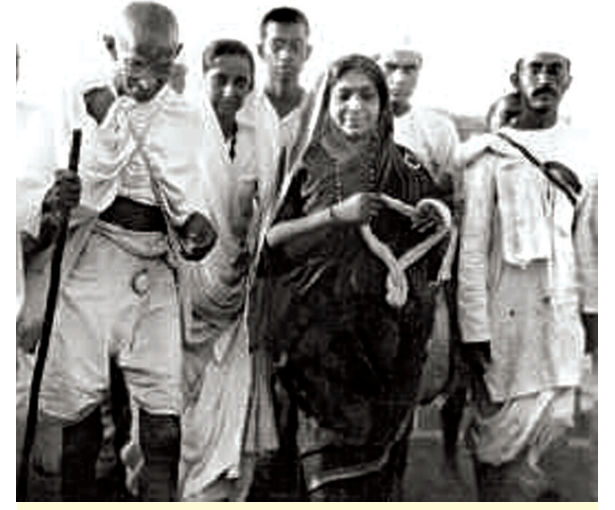
હિન્દ છોડો આંદોલન

મીઠા ઉપર અંગ્રેજ સરકારના ઈજારાનો વિરોધ કરવા માટે ગાંધીજી દ્વારા દાંડી સત્યાગ્રહની શરૂઆત કરવામાં આવી હતી. તેમણે ૧૨મી માર્ચ, ૧૯૩૦ના રોજ દાંડી યાત્રાનો આરંભ કરવામાં આવ્યો હતો. આ યાત્રા સાબરમતી આશ્રમથી શરૂ કરીને ૨૬ દિવસ પછી ૬ એપ્રિલ, ૧૯૩૦ના રોજ દાંડીમાં સમાપ્ત થઈ હતી. ગાંધીજી દ્વારા મીઠાના કાયદાની અવલેખના કરવામાં આવી અને લોકોએ સ્થાનિક કક્ષાએ મીઠું બનાવવાની અને વેચવાની શરૂઆત કરી. આ સત્યાગ્રહ પણ અહિંસક હતો, જેણે સમગ્ર વિશ્વનું ધ્યાન પોતાની તરફ ખેંચ્યું અને સ્વતંત્ર ભારતના સ્વપનને મજબૂત કરવાનું સૌથી મહત્વનું કામ પણ કર્યું.