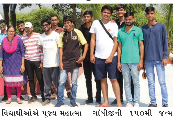
શૈક્ષણિક પ્રવાસની સાથે વિદ્યાર્થીઓએ પૂજ્ય મહાત્મા ગાંધીજીની ૧૫૦મી જન્મ

ગાંધીનગર, તા. ૧૩ સરકારી વિજ્ઞાન કોલેજ, સેક્ટર-૧ પના ટી. વાય. બી. એસ. સી. બોટનીના વિદ્યાર્થીઓએ વઘઈ બોટનીકલ ગાર્ડન અને સાપુતારા વન્ય વિસ્તારનો શૈક્ષણિક પ્રવાસ કર્યો હતો, જ્યાં તેમણે જૈવ-વિવિધતા સાથે અલભ્ય અને અપ્રાપ્ય વનસ્પતિઓનો અભ્યાસ કર્યો હતો અને તેના ઔષધિય ઉપયોગ અંગે માહિતી પ્રાપ્ત કરી હતી.