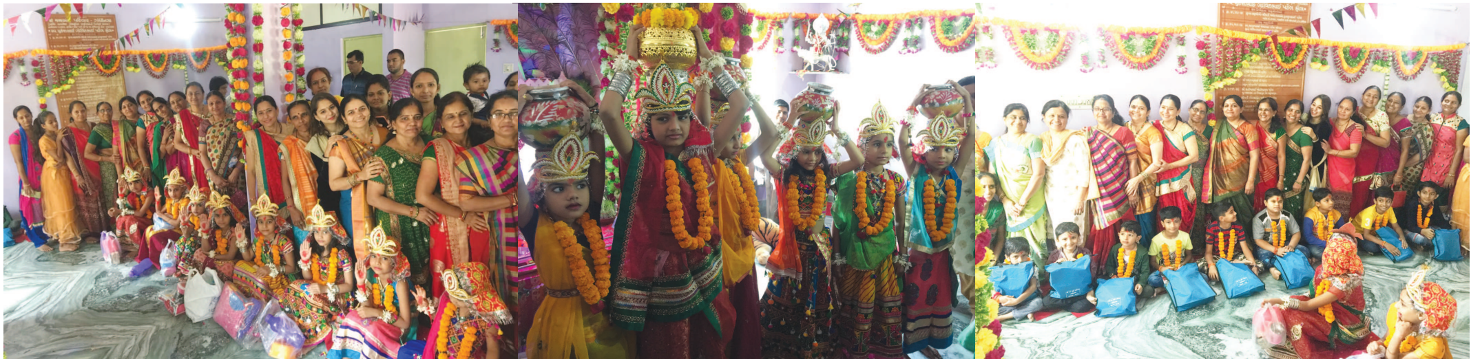
ગાંધીનગર, તા. ૧૪

નવરાત્રિ એટલે માત્ર રાસ ગરબા નહીં પરંતુ આદ્યશકિત મા જગદંબાની આરાધના કરવાનું એક આધ્યાત્મિક પર્વ છે. જેમાં શકિતની ઉપાસનાનું અને મહત્ત્વ રહેલું છે. આજ રીતે નવરાત્રિમાં બાળા પૂજન અને બટુક પૂજન પણ મહત્ત્વ ધરાવે છે. ગાંધીનગરના સે-૧માં જય અંબે પરિવાર દ્વારા નવરાત્રિ નિમિત્તે બાળા પૂજન તથા બટુક પૂજન યોજવામાં આવ્યું હતું. નવદુર્ગા એટલે મા જગદંબાના નવ સ્વરૂપો જેની નવરાત્રિ દરમિયાન આરાધના કરવામાં આવે છે. નવરાત્રિ દરમિયાન નાની કુમારિકાઓનું પૂજન એ નવદુર્ગાના પૂજન સમાન ગણાય છે. આજ રીતે નાના બટુકો જેમની ઉંમર ૫ થી ૧૧ વર્ષ સુધીની હોય છે તેમની પણ પૂજા કરવામાં આવે છે. ગાંધીનગરના સે-૧માં પ્રસિધ્ધ જય અંબે પરિવાર દ્વારા ચંડિપાઠમાં જેનું મહત્ત્વ દર્શાવ્યું છે તે મુજબ નવદુર્ગા પૂજન હાથ ધરાવ્યું હતું. જેમાં નવકુમારિકા અને નાના બટુકોનું પૂજન કરાયું હતું.