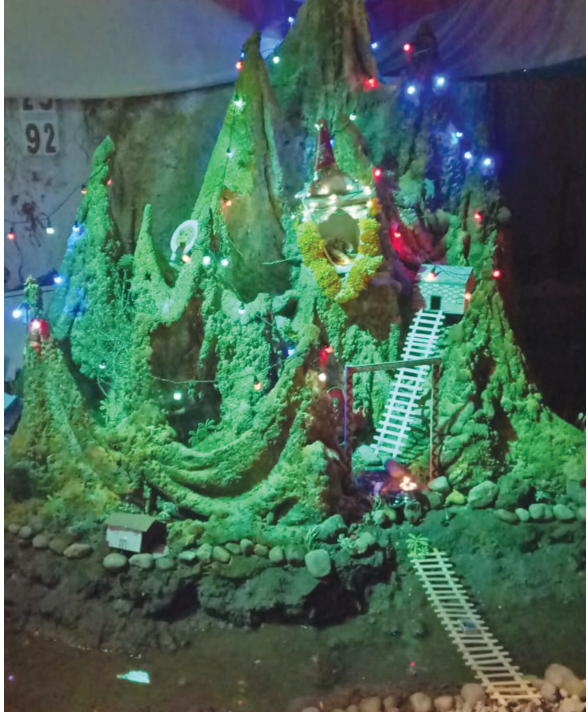
નવરાત્રિમાં બાળકોનો ઉમંગ પણ હેયે ઉભરાતો જોવા મળે છે. શહેરના સેક્ટર-૨ ૪માં શ્રીનગર હાઉસિંગ બોર્ડ ખાતે સનેડો નવરાત્રિ મંડળ દ્વારા આયોજિત શેરી ગરબા મહોત્સવ ખાતે બાળકોએ ગબ્બર બનાવી તેને લાઈટીંગથી સજાવ્યો છે અને ગબ્બર ગોબમાં અંબે માતાનું સ્થાપન કરી બાળકો દરરોજ પૂજા આરતી પણ કરી રહ્યા છે.