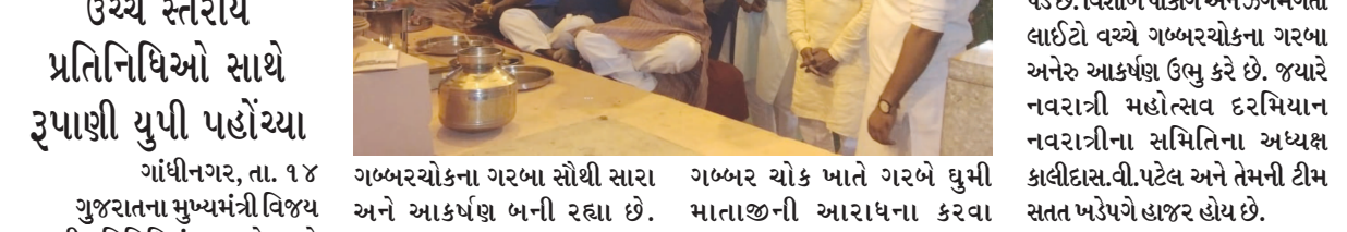
ગબ્બરચોકના ગરબા સૌથી સારા અને આકર્ષણ બની રહ્યા છે. ગબ્બર ચોક ખાતે ગરબે ધુમી માતાજીની આરાધના કરવા

સેક્ટર-૨૨ સાર્વજનિક નવરાત્રી મહોત્સવ સતત ૨૯ વર્ષથી વેપારી મિત્રો અને વસાહતીઓના પારસ્પરિક સહયોગ અને અથાગ જહેમતથી ગબ્બર ચોક સે-૨૨માં નવરાત્રી મહોત્સવની ઉચ્ચ સ્તરીય પ્રતિનિધિઓ સાથે રૂપાણી યુપી પહોંચ્યા