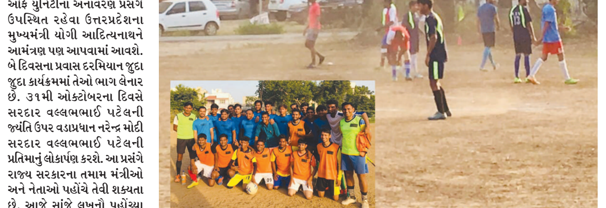
ગાંધીનગર શહેરના સેક્ટર-૩ ન્યુ શેરી વાઈકીંગ ક્લબ દ્વારા બે દિવસીય ફૂટબોલ ટૂર્નામેન્ટનું આયોજન કરવામાં આવ્યું હતું. આ ફૂટબોલ ટૂર્નામેન્ટમાં રાજ્યભરમાંથી ૨૦થી વધુ ટીમોએ ભાગ લીધો હતો. જ્યારે વિજેતા ટીમને રોકડ પુરસ્કાર અને ટ્રોફી આપી સન્માનિત કરાઈ હતી. ફૂટબોલની મેચ નિહાળવા માટે સ્થાનિક નાગરીકોની ભારે ભીડ જોવા મળી હતી.