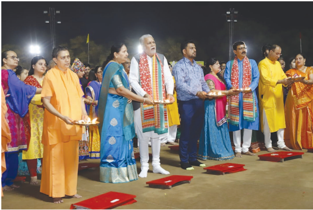
ગાંધીનગર કલ્ચરલ ફોરમના આંગણે કેન્દ્રીય કૃષિ રાજ્યમંત્રી પરસોતમ રૂપાલા પધાર્યા હતા. જેમનું સંસ્થાના અધ્યક્ષે ખેસ પહેરાવી સ્વાગત કર્યું હતું. પરસોતમ રૂપાલાએ આદર્શકિતિ મા જગદંબાની આરતી ઉતારી હતી. આ સાથે સે. ૧ના સમદર્શન આશ્રમના પૂ. ગુરૂમા સહિત મહેલા અગ્રણીઓ પણ ગરબામાં પધાર્યા હતા. ચોથા નોરતે રાજ્યના જાણીતા ગાયિકા દર્શના ગાંધી ઠક્કર અને રિશીન સરેયાએ ગરબાની ધૂમ મચાવી હતી જેને ખેલેયાઓની હકડેહઠ મેદનીએ મનભરીને માણી હતી.