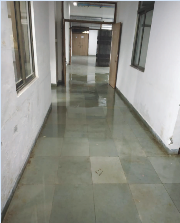
દર્દીઓ વિવિધ રોગની સારવાર માટે આવે છે. તાવથી માંડીને

ગાંધીનગર સિવિલ હોસ્પિટલમાં રોજના હજારો હિમોડાયલિસીસ સુધીની સારવાર થાય છે. સિવિલમાં