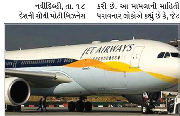
કંપની ટાટા ગ્રુપ કંપનીએ સંકટગ્રસ્ત જેટ એરવેઝમાં મોટી હિસ્સેદારી ખરીદવા માટે શરૂઆતી વાપસી

મોટી હિસ્સેદારી ખરીદવાને લઈને વાતચીતની પ્રક્રિયા શરૂ : નરેશ ગોયેલની જેટ એરવેઝ પાયલોટોના પગાર અને કર્મચારીઓના પગારની ચુકવણીને લઈને પણ પરેશાન