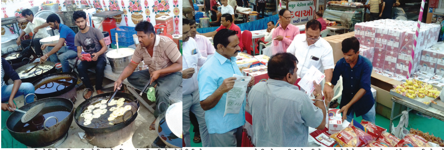
ગુજરાતીઓ વિશે ઘણી સારી-ખોટી વાતો દુનિયામાં વહી રહી છે. એ પૈકીની એક વાત એ પણ છે કે ગુજરાતીઓનો કોઈપણ તહેવાર ખાવાની વાત વિના પતે નહીં. આ વાત સાચી છે કે ખોટી એ ચકાસ્યા વિના હાલ ચાલી રહેલા દશેરાના પર્વ સામે જોઈએ તો આપણે ત્યાં ફાફડા-જલેબી-ગોળાકળી ઉદ્યોગની જેમ બને છે ને વેચાય છે. દરેક પ્રસંગે ગુજરાતીઓ માટે ખાવાની વાત વધારે જરૂરી છે એના કરતાં ગુજરાતીઓ દરેક પ્રસંગે સંપૂર્ણ રીતે ઉજવી જાણે છે એ ઉક્તિ આ તસવીરો જોતાં સાચી લાગે છે.