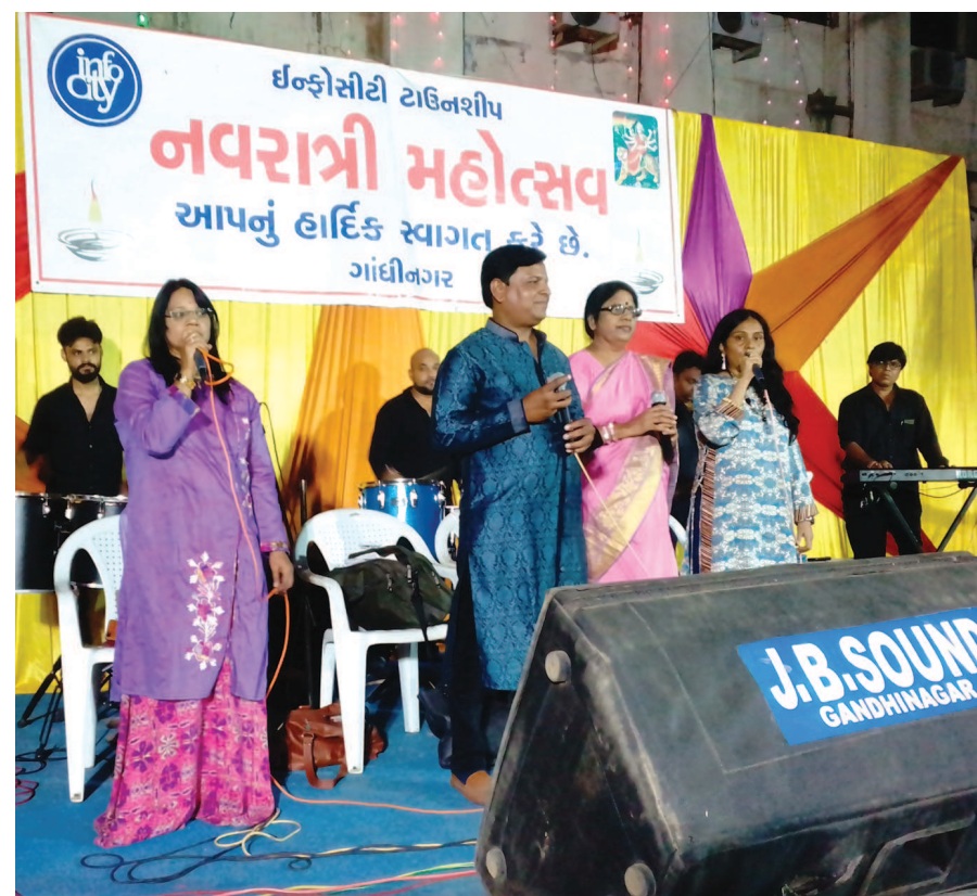
ગાંધીનગરના આંગણે સ્થિત ઈન્ફોસિટી ટાઉનશીપમાં પરંપરાગત રંગમાં નવરાત્રીની ઉજવણી થઈ હતી, જે પરાકાષ્ટાએ પહોંચી ત્યારે આભાલવૃદ્ધ મન મૂકીને ગરબે ધૂમતા જોવા મળ્યા હતા. ગીત-વાદ્યકારો પણ જાણે રંગમાં આવી ગયા હોય તેવો માલો સર્જાયો હતો.