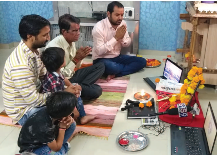
પુરુષોત્તમ ભગવાન શ્રીરામનો રાવણ પર વિજય, સત્યનો અસત્ય પર ધર્મનો અધર્મ પર અને ન્યાયની અન્યાય પર જીત છે. વિજયાદશમીના દિવસે વિરમગામ સહીત અમદાવાદ જીલ્લાના શસ્ત્ર પૂજન કરવામાં આવ્યું હતું ત્યારે વિરમગામમાં પત્રકારો દ્વારા કટારની સાથે કલમ રૂપી શસ્ત્રની પુજા કરવામાં આવી હતી. અમદાવાદ જીલ્લા મિડીયા કલબ આયોજન કાર્યક્રમમાં

ગાંધીનગર, તા. ૧૮ અમદાવાદ જીલ્લા મિડીયા કલબ આયોજન કાર્યક્રમમાં પત્રકારો દ્વારા કટાર, કલમ, કેમેરા, લેપટોપ, અખબારોનું પુજન અર્ચન કરવામાં આવ્યું. વિજયાદશમી શક્તિની ઉપાસનાનો તહેવાર છે. શક્તિનો અર્થ છે - બળ, સામર્થ્ય અને પરાક્રમ. દરેક વ્યક્તિ પોતાની શક્તિનો ઉપયોગ જુદી જુદી રીતે કરે છે. દુર્જન વ્યક્તિ જ્ઞાનનો ઉપયોગ વ્યર્થ વિવાદ અને ચર્ચામાં કરે છે. ધનનો ઉપયોગ અહંકારના દેખાવમાં, બળનો ઉપયોગ બીજાને નુકશાન પહોંચાડવામાં કરે છે. તેનાથી વિપરિત સદાચારી વ્યક્તિ પોતાની શક્તિનો ઉપયોગ જ્ઞાન પ્રાપ્તિ, બીજાની સેવામાં અને પોતાના ધનનો ઉપયોગ સારા કામ કરવા માટે કરે છે. આ રીતે શક્તિ માણસમાં કર્મ, ઉત્સાહ અને ઉજ્જવનો સંચાર કરે છે. વિજયાદશમીએ મહાદા