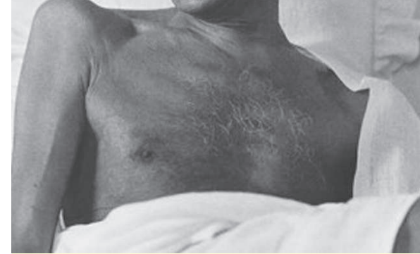
સૌજન્ય : કુંતલ નિમાવત સંપાદિત પુસ્તક 'ગાંધીકથા' કથાકાર : સ્વ. શ્રી નારાયણ દેસાઈ

આમ, નિત્ય વિકાસશીલતા એ ગાંધીનો એક બીજો ગુણ. આ બધું થયું એને પરિણામે એણે જે વિકાસ કર્યો એ વીકાસથી ગાંધીજી આગળ વધ્યા ને પછી ગાંધીજીને વિશે લોકો એમ સમજ્યા કે ગાંધીજીએ સ્વરાજ અપાવ્યું. (ક્રમશઃ)