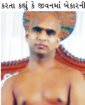
બાબતો તો જાતે મળી જાય છે જ્યારે શ્રેષ્ઠની ઉપલબ્ધિ માટે અથાક પ્રયાસો કરવા પડે છે અને વિવેકને

ગાંધીનગર, તા. ૨૪ પર્વત ચઢતા મહેનત થાય છે પણ ઉતરતા નહિ, સાર્થકતાની સિદ્ધિ મેળવવા પુરુષાર્થ કરવો પડે પણ નિર્થકતા માટે નહિ, ગીત ગાવા માટે અભ્યાસ કરવો પડે પણ ગાળ આપવા માટે નહિ. એટલે દુર્ગુણો તો પ્રકટ થઈ જાય છે પણ સદગુણો વિકસાવામાં ઘણો પરિશ્રમ થાય છે. સાર્થકતાની સિદ્ધિમાં પણ પુરુષાર્થ કરવું પડે પણ વ્યર્થની નિરર્થક પ્રવૃત્તિઓ માટે કઈ કરવું પડતું નથી. પરમ ઉપકારી આચાર્ય સુનીલ સાગરજી મહારાજ સુખી, સહજ