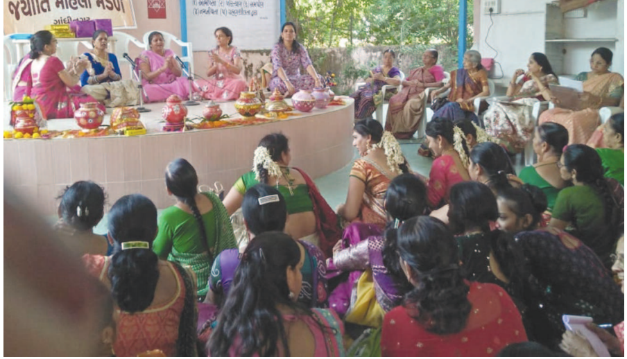
૨૫૦ બહેનોએ ભાગ લીધો : શાસ્ત્રીય રાગ આધારિત પરંપરાગત ગરબા

ગાંધીનગર તા ૨૪ નવરાત પર્વના અંતે એકબાજુ શરદોત્સવની ઉજવણીને અનુલક્ષી ઠેર ઠેર ગરબાનું આયોજન કરવામાં આવ્યું છે. જ્યારે સેક્ટરોમાં બેઠા ગરબા સ્પર્ધા પણ યોજવામાં આવી રહી છે. જ્યોતિ મહિલા મંડળ દ્વારા સતત ૪૮ માં વર્ષે આયોજિત બેઠા ગરબા સ્પર્ધામાં ૨૫૦ થી વધુ બહેનોએ ભાગ લીધો હતો. બેઠા ગરબા સ્પર્ધા ઉપરાંત ગરબા શણગાર સ્પર્ધામાં પણ બહેનોએ કલાત્મક અંદાજથી સુશોભિત ગરબા રજૂ કર્યા હતા. શાસ્ત્રીય રાગ આધારિત પરંપરાગત ગરબા રજૂ કરી સૌના દિલ જીતી લીધા હતા. જ્યોતિ મહિલા મંડળ દ્વારા સે-૨૩