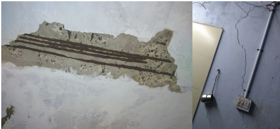
સેક્ટરોમાં સ્થિત જુદી જુદી કક્ષાના સરકારી આવાસો પેકી રહેણાંકની ઢ્રીએ યોગ્ય હોય તેવા મકાનોની

ગાંધીનગર, તા ૨૪ શહેરમાં સરકારી આવાસોની હાલત બદલતર છે. દિન પ્રતિદિન સરકારી આવાસોમાં પોપડા ખરવા ઉપરાંત દિવાલોમાં મોટીમસ તિરાડો હોવાની ફરિયાદો પણ ઉઠવા પામે છે. સે-૧૭ માં સ્થિત હોમગાર્ડ યુનિટની કચેરી જ જોખમી હાલતમાં છે. છતમાંથી મોટા મસ પોપડા ખરવાની સાથે દિવાલો ઉપર તિરાડો નિકળતા ભયજનક મકાનમાં ગમે ત્યારે અકસ્માત સર્જાય તેવી દહેશત પણ વ્યક્ત કરવામાં આવી રહી છે. ગાંધીનગરના વિવિધ