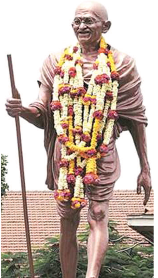
સૌજન્ય : કુંતલ નિમાવત સંપાદિત પુસ્તક 'ગાંધીકથા' કથાકાર : સ્વ. શ્રી નારાયણ દેસાઈ

ફૂલ ત્રણ પ્રશ્નો હતા. જેમાંથી પહેલા બે પ્રશ્નોમાં ગાંધીજીએ બે મિનિટ કરતાં વધારે નહીં લીધી અને ત્રીજા પ્રશ્નમાં આઠ મિનિટ. ત્રણેય પ્રશ્નો મજાના છે. આપણી આજની કથાનો વિષય ત્રીજા પ્રશ્નને લગતો છે. પણ આગલા પ્રશ્નોમાં પણ શ્રોતાઓને રસ પડે તેવો છે તેથી કહી દઈએ. પહેલો પ્રશ્ન હતો : તમારી આટલી લાંબી જિંદગીમાં સંકટકાળ તો અનેક આવ્યાં હશે. આ સંકટકાળમાં તમને ટકાવી રાખનારું તત્ત્વ કયું ? આ ધર્મના સંમેલન અંગે આવેલા લોકો. પ્રશ્ન પૂછનાર માણસ એક રેવરન્ડ અને ડોક્ટરેટ કરેલો એક પાદરી. કદાચ જવાબ પણ અપેક્ષિત હતો. (કમશ) :