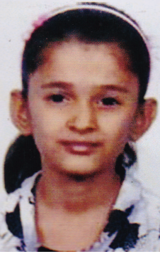
ફેચા એસ કામલીયા