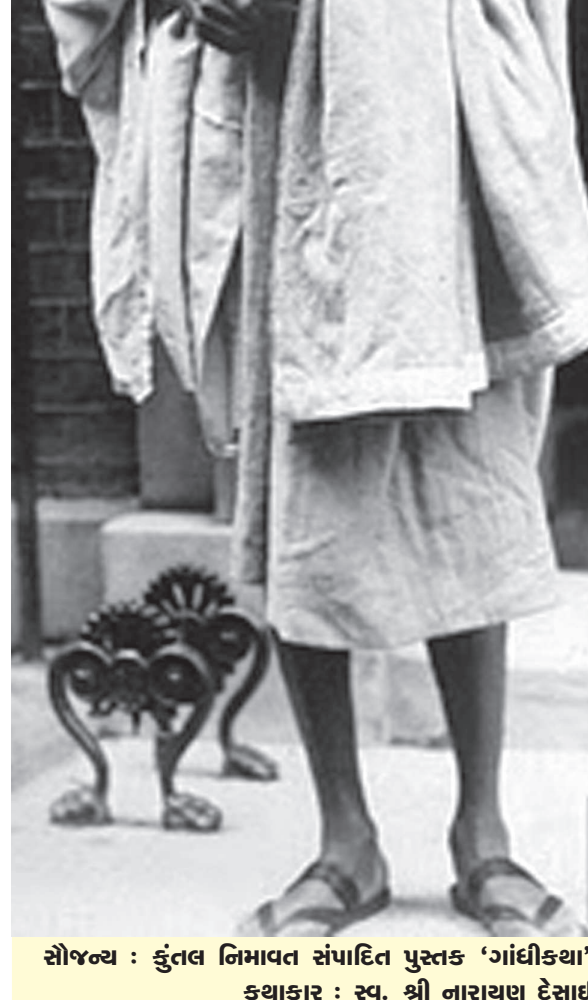
સૌજન્ય : કુન્તલ નિમાવત સંપાદિત પુસ્તક 'ગાંધીકથા' કથાકાર : સ્વ. શ્રી નારાયણ દેસાઈ

ગાંધીયાત્રા એનો મતલબ એમ કે અહીં અન્યાય થાય છે અને અન્યાય સહન પણ થાય છે, એવું એમણે વિચાર્યું.