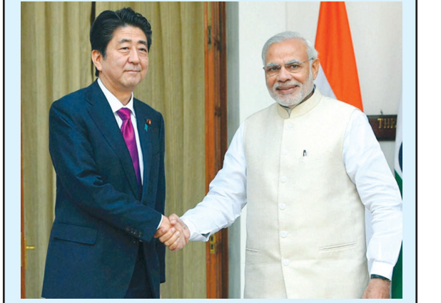
ટોક્યો, તા. ૨૮

મોદીએ શિન્જો આબેને ગુજરાતી શિલ્પકારે બનાવેલી વસ્તુઓ ભેટ આપી : જે દિવસે મુંબઈ-અમદાવાદ હુલેટ ટ્રેન દોડશે તે દિવસે ભારત-જાપાનની મિત્રતાને ચમકાવતો સંકેત હશે : આબે