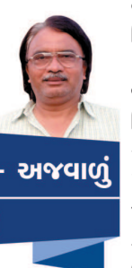
અજવાળું - અજવાળું તુષાર જોદાઈ

હોસ્પિટલોમાં ગરીબ દર્દીઓને દાખલ થતા જોયા છે, દર્દી સાજા થાય એની ચિંતાની સાથે સાથે જ દર્દીની ચિકિત્સાના, સારવારના, દવાના, ફળ-ફુટ કે સાથે આવેલ વ્યક્તિના ભોજન-નિવાસના રોજિંદા ખર્ચાની ચિંતા અને એથી વધુ હોય છે. અનેક જાતની વિટંબણાઓ સહન કરવી પડે છે. આ ગરીબ અને અજાણ દર્દીઓ અને તેના સગાઓને... આ દર્શ્યોમાં સમાયેલી કરુમતા, લાચારી, ન વહેલા આંસુ, પ્રેમ, મજબૂરી માનસિક યાતના એ તો જેણે અનુભવ કર્યો હોય તે અથવા કોઈ સહૃદય માનવીએ આ દર્શ્યોને લગાણીભીની આંખે જોયા હોય તે સમજી શકો. આવા ગરીબ દર્દીઓની મદદ કોણ કરે ? એમના તો સગા-વહાલા પણ એમના જેવા જ ગરીબ હોય !! કોણ શહેને ટેકો આપે ?? સમય બદલાયો છે, લોકો આત્મના દસ ટકા નહિ તો બે-પાંચ ટકા પણ ખર્ચીને દાન રૂપે આપતા થયા છે, સમર્પિત ભાવે કામ કરવા લોકો અને આવી સંસ્થાઓ છે. જે ઉત્તમ સેવા કાર્ય કરી રહી છે. ભાવનાશીલ ડોક્ટરો છે, કેમિસ્ટો છે, સ્વયંસેવકો છે જે આવા દર્દીઓની પડખે તન-મન-ધનથી ઊભા રહે છે. બાટંવાથી જુનાગઢને ત્યાંથી અમદાવાદ આવેલો એક પરિવાર એમની વહાલ સોઈ દીકરીની સારવાર માટે કાનની વાળી વેચવાની અસહાય સ્થિતિમાં આવે છે. સમાજના ઘડવેયા જેવા શિક્ષક લકવાની બિમારીમાં સપડાય, ગામડા ગામમાંથી રૂા. ૪૦૦ ઉધાર લઈને નીકળેલા પરિવારનો દર્દી કમળીના રોગની સારવાર લેતો થાય, ધોળકા તાલુકાના લોકીયા ગામની દીકરીને ધનુર થાય અને અમદાવાદ આવે ત્યારે સારવાર ને દવા તો ઠીક, ઘરે જાય ત્યારે પણ દસ દિવસની દવા અપાય... અમરેલીના પિયાવા ગામના દીકરાને આપે ?? સમય બદલાયો છે, લોકો આત્મના દસ ટકા નહિ તો બે-પાંચ ટકા પણ ખર્ચીને દાન રૂપે આપતા થયા છે, સમર્પિત ભાવે કામ કરવા લોકો અને આવી સંસ્થાઓ છે. જે ઉત્તમ સેવા કાર્ય