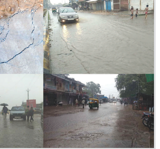
વરસાદના કારણે ખેડૂતો દ્વારા કરાયેલા વાવેતરને ભારે નુકસાન ના અંધાણ વર્તાયા છે તાલુકા

પાણી ભરાયા છે ત્યારે ગરબા રસિકો નિરાશ થયા છે મોટાભાગ આયોજન કરેલ ગરબાના ગ્રાઉન્ડમાં પાણી ભરાઈ જતા ખેલેયાઓ અને આયોજકો માં નિરાશા જોવા મળી હતી જ્યારે અતિ વરસાદના લીધે ખેડૂતોમાં પણ નિરાશા જોવા મળી રહી છે ખેતી રૂપે હાથમાં આવેલો કોળિયો છીનવાઈ જવાની ખેડૂતોમાં ભીતિ સેવાઈ રહી છે બેડબ્રહ્મા તાલુકામાં મોટાભાગના નદીનાળા છલકાયા છે જ્યારે લીલો દુષ્કાળ થવાની