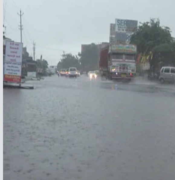
જ્યારે ભિલોડા તાલુકામાં પણ ૧ મીટી સેવાઈ રહી છે સતત થઈ રહેલા વરસાદને લીધે નુકસાન થાય છે.

વરસાત મોડાસા ધનસુરા હાઈવે પર વૃક્ષો ધરાશાયી થવાની ઘટનાઓ ઘટી હતી, જેને કારણે વાહન ચાલકોને હાલાકીઓનો સામનો કરવો પડ્યો હતો. ભારે વરસાદને પગલે વિજિભિલિટી નહીંવત હોવાને કારણે વાહન ચાલકોએ હેડ લાઈટ ચાલુ રાખવાનો વારો આવ્યો હતો. અરવલ્લી જિલ્લામાં છેલ્લા બે કલાક એટલે કે, સાંજે ૪ થી ૬ વાગ્યા સુધીમાં ધનસુરા તાલુકામાં ૨.૫ ઈંચ વરસાદ ખાબક્યો હતો.