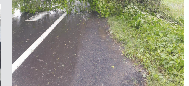
બરના ખેડૂતો ના બેહાલ થયા છે.