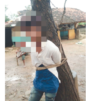
એક ગામમાં યુવક-યુવતીની આંખ મળી જતા પ્રેમ સંબંધ

મેઘરજ, તા. ૩૦ પ્રેમમાં અંધ બની પ્રેમી-પંખીડાઓ તમામ મર્યાદાઓ હટાવી દેતા હોય છે. પ્રેમિકાને મળવા પહોંચતા અનેક યુવકો પરિવારજનો અને ગ્રામજનોનો રોષનો ભોગ બન્યા છે. કેટલાક કિસ્સામાં પરિવારજનો અને ગ્રામજનો પ્રેમી યુવકને જાહેરસ્થળ પર લાવી તેની સાથે તાલિબાની સજા કરવામાં આવતી હોવાની ઘટનાઓમાં નોંધપાત્ર વધારો થયો છે. અરવલ્લી જિલ્લાના મેઘરજ તાલુકાના અંતરિયાળ વિસ્તારમાં બંધાયો હતો. યુવતીના પરિવારજનો અંદેશો આવી જતા યુવતીને ઘરે રાખતા હતા. પ્રેમમાં પાગલ બનેલ યુવક યુવતીના ઘરે બાઈક લઈ મળવા પહોંચતા પરિવારજનોએ યુવકને ઝડપી પાડ્યો હતો અને ઝાડ સાથે રસ્સીથી બાંધી દઈ થોડા સમય પછી રસ્સીથી બાંધેલી હાલતમાં યુવતીના પરિવારજનો અને ગ્રામજનો યુવકને ગામ બહાર મુકવા જતા હોવાનો વિડીયો સોશલ મીડિયામાં વાઈરલ થતા ચક્રચાર મચી હતી.