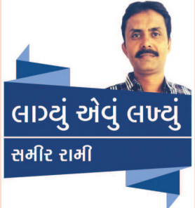
લાઠવું એવું લાઠવું સમીર તાલોડ

નશો કરીને કે મોબાઈલ પર વાત કરતા કે મેસેજ ચેક કરતા વાહન હંકારવાની બેદરકારી અથવા ગીચ રહેણાંક વિસ્તારમાં પણ વધુ પડતી ઝડપે વાહન હંકારી ચાલુ વાહને એકબીજા સાથે વાતો કરવી, રેલ્વે કોસીંગ કે અન્ય ટ્રાફિક જામ સ્થળે રોંગ સાઈડથી આગળ નીકળવું, રોંગ સાઈડથી ઓવરટેક કરવો, મોડી રાત્રીના સમયે સુમસામ માર્ગો પર બેંકિંગ કરાઈ ભર્યું ડ્રાઈવિંગ કરવું, વહેલી પરોઢ કે સાંજના સમયે યોગ્ય પ્રકાશના અભાવમાં ઓવર સ્પીડ ડ્રાઈવ કરવું કે વાહનની લાઈટ ચાલુ ના કરવી, હેલ્મેટની કલીપ બંધ કર્યા વગર તે ઉડીને બીજા માટે જોખમી બને તે રીતે પહેરવો જેવી અનેક બાબતોનો પણ સમાવેશ થાય છે. આ તમામ બેદરકારીઓ ‘માત્ર’ આકરો દંડ કરી લેવાથી દૂર થઈ રાતોરાત ‘ટ્રાફિક સેન્સ’ નહીં આવી જાય પરંતુ આ આદતો સુધારવા યોગ્ય ટ્રાફિક શિક્ષણ સાથે વાહન નિયમન તંત્ર દ્વારા ડ્રાઈવિંગ લાયસન્સ માટેની યોગ્યતાથી માંડીને તમામ બાબતે ‘વહીવટ’ કરી લેવાની વૃત્તિ સંદર્ભ નાથી પડશે જ. - પ્રતિભાવો અધિકાર્ય : samirtalod@yahoo.com