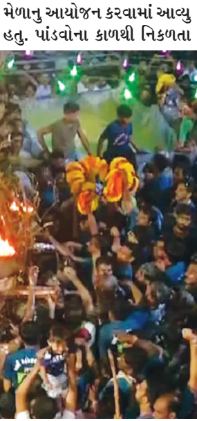
પલ્લી રથના દર્શન કરવાનો ભાવિકોમાં અનેરો મહીમા છે.