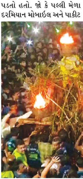
યોર પણ સક્રિય રહ્યા હતા. રૂપાલમાં આજે ભવ્ય પલ્લી

ગાંધીનગર તા. ૮ રૂપાલ વરદાયિની માતાના દિવ્ય પલ્લી રથ પર ભાવિકોએ અંદાજિત ૪ લાખ કીલો ધીનો અભિષેક કર્યો હતો. અંદાજે ૩૧૬ કરોડના ધી ના અભિષેકથી રૂપાલ ગામમાં ધી ની નદી વહેતી થઈ હતી. સવારે ૪ : ૩૫ કલાકે ભવ્ય પલ્લી રથનો પ્રારંભ થયો હતો. જ્યારે ગામના ૨૭ ચકલા પર પલ્લી રથ પસાર થઈને સવારે ૭ : ૩૦ કલાકે વરદાયિની મંદિરના પરિસરમાં પહોંચ્યો હતો. અંદાજિત ૧૦ લાખ ભાવિકોએ દર્શનનો લાભ લીધો હતો. શાંતિપુર્ણ માહોલમાં પલ્લી મેળો સંપન્ન થયો હતો. પલ્લી રથના દર્શન માટે ભાવિકોનું ઘોડાપુર ઉમટ્યું હતું. જ્યારે પલ્લી મેળાના આયોજનને અનુલક્ષી પુરતો સલામતી બંદોબસ્ત પણ નજરે