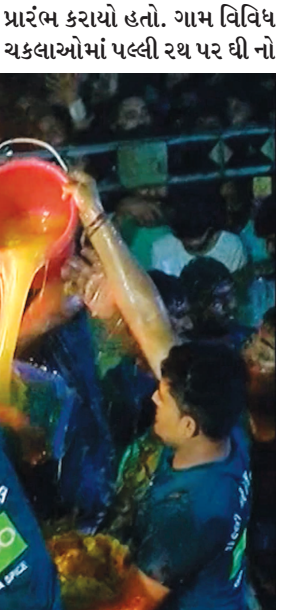
અભિષેક કરવામાં આવ્યો હતો. ગામમાં વિવિધ ઠેકાણે ટ્રેક્ટરની