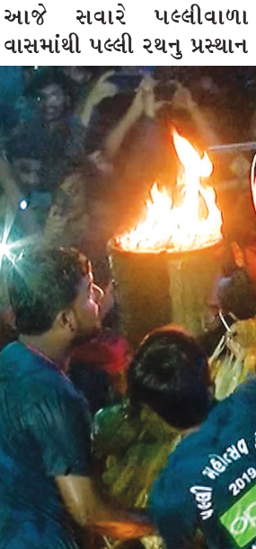
કરાયુ હતુ. સવારે ૪ : ૩૫ કલાકે માતાજીની દિવ્ય પલ્લી રથનો