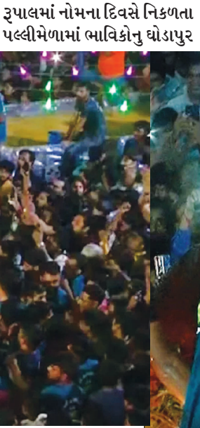
ઉમટે છે. રૂપાલ ગામમાં પરંપરાગત પલ્લી મેળાને અનુલક્ષી