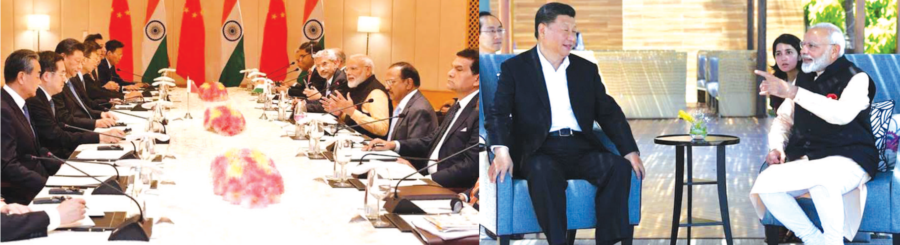
વચ્ચે દ્વિપક્ષીય મુદ્દાઓ ઉપર વાતચીત થઈ છે. તમિળનાડુના કોવલમ સ્થિત ફિશરમેન કુવ

મતભેદોને ઉકેલવા યુદ્ધના રોડ મેપનો ઉલ્લેખ કર્યો હતો. યુદ્ધના સ્પીરિટથી સંબંધોમાં નવી ગતિ આવી છે. ચીની પ્રથમ દિવસે વડાપ્રધાન નરેન્દ્ર મોદી સાથે ઐતિહાસિક સ્મારકોને નિહાળ્યા બાદ અને તેમની સાથે