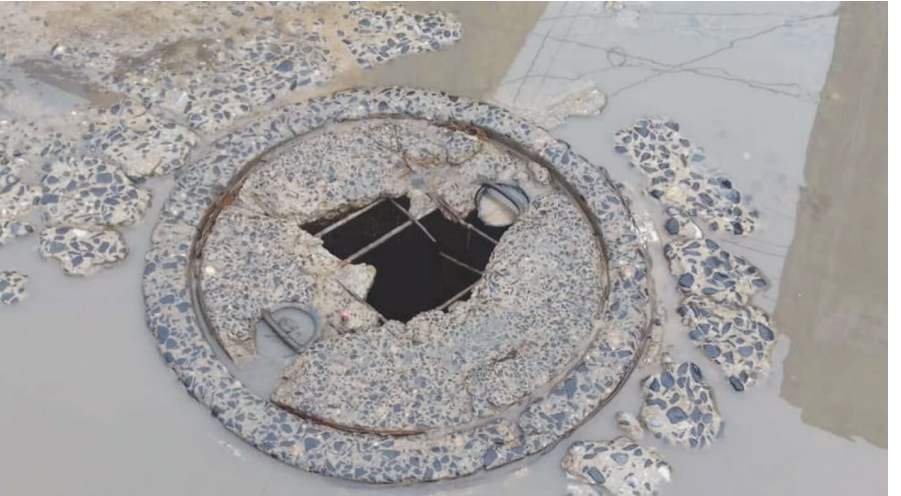
દાનેરામાં ભુગર્ભ ગટર યોજનામાં વપરાયેલ મટીરિયલમાં દેખાતો મોટો ભટ્ટાચાર ધાનેરા માં પાણી પુરવઠા વિભાગ માં ભુગર્ભ ગટર યોજના માટે સરકાર શ્રીએ ૧૮ કરોડની ગ્રાન્ટ મંજૂર કરેલ છે પરંતુ બરેબર આ ગ્રાન્ટમાં ખૂબ મોટો ભટ્ટાચાર થયેલો જોવા મળી આવે તેમ છે જે બે વર્ષના કોન્ટ્રાક્ટ માં આજે પાંચ વર્ષ પૂરા થયા હોવા છતાં પણ કામ અધુરૂ જોવા મળી રહ્યું છે કોન્ટ્રાક્ટર દ્વારા ભુગર્ભ ગટર ઉપર મુકવામાં આવેલ ગટર નાં ઢાંકણ પણ હલકી કક્ષાના હોવાથી મોટા ભાગના ઢાંકણાં અમુક જગ્યાએ તુટેલા જોવા મળ્યા હતા કોન્ટ્રાક્ટરો દ્વારા તકલાદી મટીરીયલ વાપરી પોતાનો લાભ લઈ રહ્યા છે જો આ બાબતે તટસ્થ તપાસ કરવામાં આવે તો ધાનેરા માં મોટું કોંભાડ જોવા મળી શકે તેમ છે આ બાબતે સરકાર શ્રી તેમજ ઉપરી અધિકારીઓ દ્વારા તપાસ કરે તેવી લોકોની માંગ છે.

મહાબલીપુરમ, તા. ૧૨ વડાપ્રધાન નરેન્દ્ર મોદીએ ચીની પ્રમુખ શી ઝિંગપિંગને કેટલીક ખાસ ભેટ આપી છે. જેમાં નચિયારકોઈલ દીપ, તંબૂર પેન્ટિંગ-ડાસિંગ સરસ્વતીનો સમાવેશ થાય છે. આ ઉપરાંત ઝિંગપિંગને એક ખાસ શોલ અને પેન્ટિંગ ભેટમાં આપી છે. લેંપ અંગે કેટલીક ખાસ વિશેષતા રહેલી છે. આઠ લોકપ્રિય કલાકારો દ્વારા મલીને તેનું નિર્માણ કરાયું છે. છ કુટ ઉંચા અને ૧૦૮ કિલોગ્રામ વજન ધરાવતા આ દીપને પિત્તળથી બનાવવામાં આવ્યું છે. જેના પર સોનાની ચાદર લગાવવામાં આવી છે. આને બનાવવામાં ૧૨ દિવસનો સમય લાગ્યો છે. તેમણે અન્ય મહત્વપૂર્ણ પેન્ટિંગો સુપરત કરી છે.