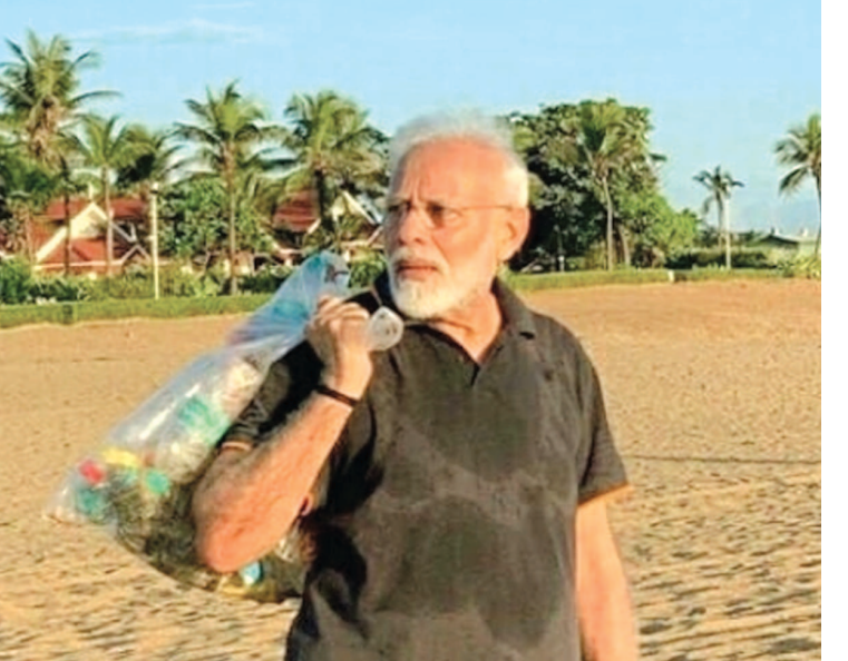
મહાબલીપુરમ, તા. ૧૨ સ્વચ્છ ભારત અભિયાનની શરૂઆત કરનાર વડાપ્રધાન નરેન્દ્ર મોદીએ આજે સવારે પોતે આમાં યોગદાન આપતા નજરે પડ્યા હતા. પોતાના મમલ્લાપુરમ પ્રવાસ દરમિયાન મોદીએ આજે સવારે દરિયાકાંઠા પર સ્વચ્છ પ્રક્રિયા હાથ ધરી હતી. મોદીએ આને લઈને વિડિયો પણ જારી કર્યો છે. વિડિયોમાં મોદી દરિયા કિનારે કચરાને લઈને સ્વચ્છતા કાર્યક્રમમાં ભાગ નેના નજરે પડ્યા હતા. વિડિયોની સાથે મોદીએ લખ્યું છે કે આજે સવારે તેઓ મમલ્લાપુરમ ખાતે બીચ પર સાફ સફાઈ કરવા માટે પહોંચ્યા હતા. આ કામ આશરે અડધા કલાક સુધી કર્યું હતું. પોતાના તરફથી એકત્રિત કરવામાં આવેલા કચરાને તેઓએ જયરાજને આપી દીધો છે. જે હોટેલ સ્ટાફનો હિસ્સો છે. મોદીએ આગળ લખ્યું છે કે હવે આ બાબતની ખાતરી કરવાની જરૂર છે કે અમારા જાહેર સ્થળો વધારે સ્વચ્છ રહી શકે. મોદી હાલમાં ચીની