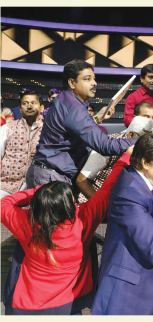
પાર્ટી, કુમાર મ્યુઝિક મેલોડી, ભખી સરકાર વગેરેમાં સ્ટેજ શોમાં પણ ગવા જવા લાગ્યા હતા અને વર્ષ ૧૯૮૬માં તેમણે