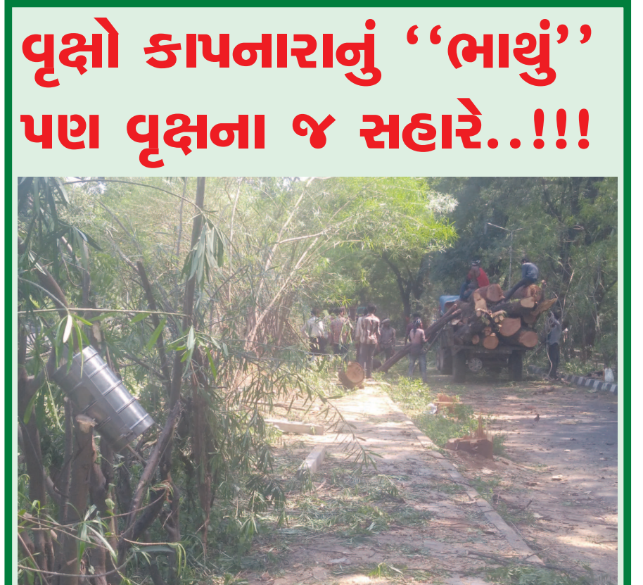
"વૃક્ષ એ જીવન છે" આવા સુનો આપણે શાળાઓની દિવાલે ચિતરાવી તો દીધાં પરંતુ હકીકતમાં જ્યારે થોડા વિકાસની જરૂર ત્યાં આપણે ઘણાં વર્ષોની જહેમત પછી ઘેઘુર વિકસેલા વૃક્ષોના કાપતાં પળભરનો પણ વિલંબ કર્યો નથી. એક વૃક્ષ માનવીને જીવનમાં કેટકેટલુ આપે છે તેના નિર્બંધે પણ બાળકો પાસે ઘણાં લખાણો પરંતુ થોડુંક સહી લેવાને બદલે કે વેકલિંગ ઉપાય શોધવાને બદલે લીલાંછમ વૃક્ષોની કલ્તેઆમ કરી દીધી છે. ગાંધીનગરના પ્રવેશદ્વાર સમા ઘ-૦ સર્કલે શહેરની શોભા સમન લીલાંછમ વૃક્ષોની જે રીતે 'કતલ' કરવામાં આવી છે તેના પગલે સરેરાશ નાગરિકોની આંતરડી કડકી ઉઠી છે. આ વૃક્ષોને કાપવાનું તથા તેના ટુકડાં કરીને ટ્રેક્ટરની ટ્રોલીઓમાં ભરવાની મજૂરીકામ કરતા શ્રમજીવીઓ પણ આખરે તો માનવી છે ને. કમને પણ પોતાની રોજગારી રળવાં કામે આવવું પડ્યું હશે પરંતુ વૃક્ષોનું મહત્વ જીવનમાં શું છે તે તેમને પણ ખબર છે જ આ કામમાં રોકાયેલા એક શ્રમજીવીએ બાજુમાં વણ કપાયેલી કરણની ડાળીએ લટકાવેલુ તેનું "ટિફિન" બહુ જ સૂચક રીતે સમજાવે છે જે વૃક્ષો માનવીનો પેટનો ખાડો પુરે છે તેને જ કાપવા છતાં તે વૃક્ષો જ માનવીનું "ભાયુ" પણ સંભાળે છે...વિધિની કેવી વિચિત્રતા..!!!

કરી છે, જે યુકેમાં અગ્રણી ઉદ્યોગપતિ છે જે વિશ્વભરમાં મેન્યુફેક્ચરિંગ અને અન્ય વ્યવસાયો સાથે યુકેમાં છે. યુનિવર્સિટી એ નફાકારક નથી અને તેનો એકમાત્ર હેતુ રાષ્ટ્રીય અને આંતરરાષ્ટ્રીય સ્તરે યુવા લોકો માટે વિશ્વની અગ્રણી શિક્ષણ પ્રોત્સાહન આપવાનો છે. ઈન્સ્ટિટ્યુટ ઓફ એડવાન્સ રીસર્ચ, ઈનોવેશન યુનિવર્સિટી, ગાંધીનગર ખાતે તેના દક્ષિણ ઈન્ડિયન ડેવી ઉજવણી કરી હતી જેમાં પ્રોફે. ભામીદીમારી રાવ, ગાંધીનગર કોસ્ટગાર્ડના ચીફ ઓફ સ્ટાફ ડીઆઈજી જી રાજેશ મકવાણા, સ્ટાફના અન્ય મેમ્બર્સ તથા સ્ટુડન્સ દ્વારા ઉજવણી કરવામાં આવી હતી.