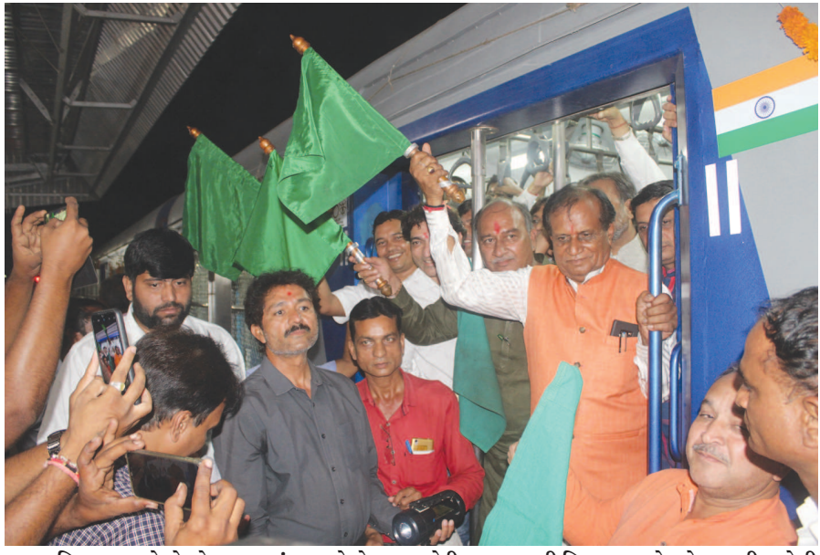
હિમતનગર રેલ્વે સ્ટેશન પર મંગળવારે બે કલાક મોડી અસારવા થી હિમતનગર ડેમુ ટ્રેન આવી પહોચી હતી જે ડેમુ ટ્રેન અડધો કલાક રોકાઈ હતી જે ૧૨ ડબ્બા ની ટ્રેનને હિમતનગર થી અસારવા જવા માટે સાસંદ દીપસિંહ રાઠોડે લીલી ઝંડી આપી પ્રસ્થાન કરાવ્યું હતું. પ્રથમ ડેમુ ટ્રેન ની ચાર ટીક્રીટ સાંસદ દીપસિંહ રાઠોડે લીધી હતી તો આજની આવક હિમતનગર રેલ્વે સ્ટેશન ૧૨ ડબ્બા રૂપિયા થઈ હતી જ્યારે અસારવા થી હિમતનગર ડેમુ ટ્રેન ને ઠેર ઠેર સ્ટેશન પર જીલ્લાની પ્રજાએ ઉત્સાહભરે સ્વાગત કર્યું હતું.