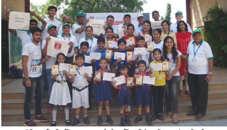
ગાંધીનગર દિલ્હી પબ્લિક સ્કૂલ દ્વારા 'સે નો પ્લાસ્ટિક'ની ઉજવણી કરવામાં આવી હતી.

ગટર ઉભરાવવાની સમસ્યા સામે તંત્રના આંખ આડા કાન સેક્ટર-૪ વિસ્તારમાં છેલ્લા એકાદ મહિનાથી ગટર ઉભરાવવાની સમસ્યા અંગે વારંવાર લેખિત અને મૌખિક ફરિયાદ કરી હોવા છતાં તંત્ર દ્વારા કોઈ પગલાં લેવાતા નથી.