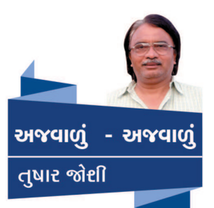
અજવાળું - અજવાળું તુષાર જોઈ