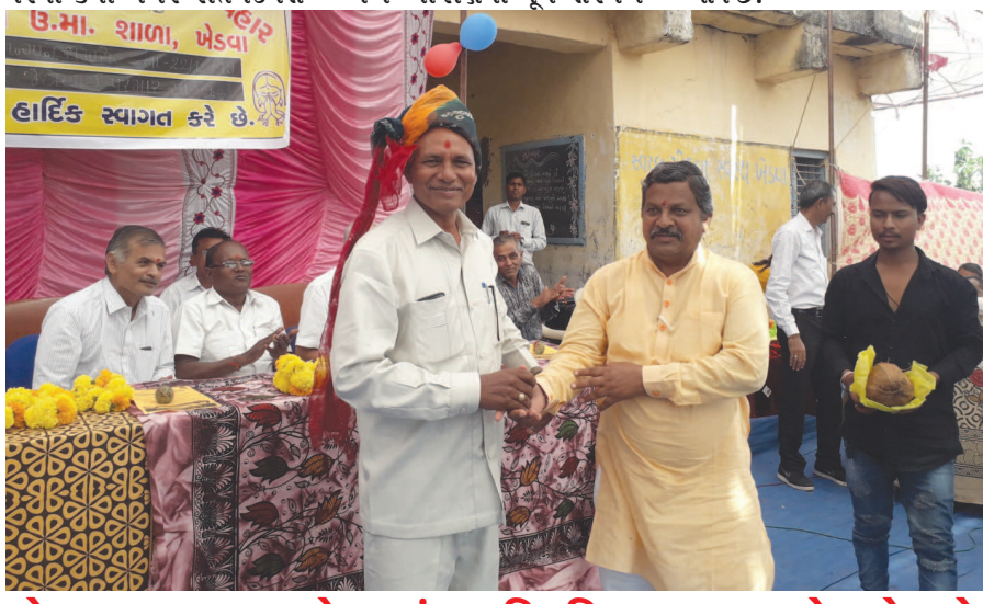
ખેડૂતોના તાલુકાના ખેડવામાં વય નિવૃત્તિ સન્માન સમારોહ યોજાયો