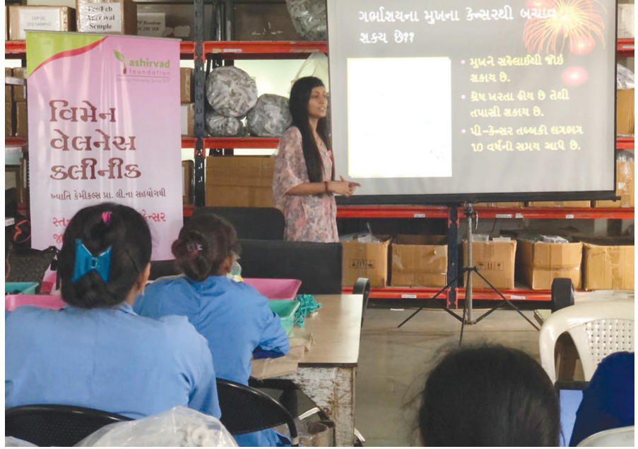
આંતરરાષ્ટ્રીય સ્તન કેન્સર જાગૃતિ અભિયાન તરીકે ઓક્ટોબર મહિનો ઉજવવામાં આવે છે તે નિમિત્તે આશિર્વાદ ફાઉન્ડેશન દ્વારા સ્તન જાગૃતિ અભિયાન શિબિર એક્ઝ્યુએક્યુટિવ લેબ પ્રાઇવેટ લિમિટેડ દ્વારા ગામ ખાતે યોજવામાં આવી હતી, જેમાં ૪૫ બહેનોએ ભાગ લીધો હતો.

જન્મદિને વધામણી વિભાગ અંતર્ગત કોઈપણ વાયક પોતાની તસવીરો પ્રકાશન માટે મોકલી શકે છે. પરંતુ, વાચકોને વિનંતી છે કે મોકલાવે તેવા પોતાની જન્મદિવસ હોય તેના અગાઉના દિવસો એક વાગ્યા સુધીમાં અખબારને મળી વાચકો ઉચ્ચે તે આ વિભાગમાં પ્રકાશન લેતુ પોતાની તસવીરો અગાઉથી પણ મોકલાવી શકે છે. - સંપાદક