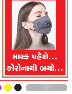
માસ્ક પહેરો... કોરોનાથી બચો...

જન્મદિને વધામણી વિભાગ અંતર્ગત કોઈપણ વાચક પોતાની તસવીરો પ્રકાશન માટે મોકલી શકે છે. પરંતુ, વાચકોને વિનંતી છે કે મોડામાં મોડી આ તસવીરો જન્મદિવસ હોય તેના અગાઉના દિવસે એક વાગ્યા સુધીમાં અખબારને મળી જાય. વાચકો ઈચ્છે તો આ વિભાગમાં પ્રકાશન હેતુ પોતાની તસવીરો અગાઉથી પણ મોકલાવી શકે છે.