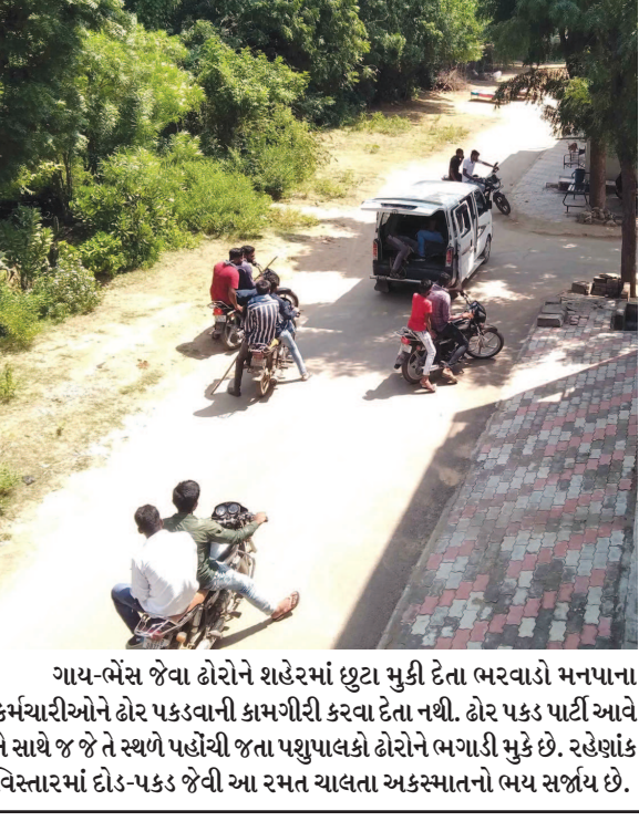
ગાય-ભેંસ જેવા ઢોરોને શહેરમાં છુટા મુકી દેતા ભરવાડો મનપાના કર્મચારીઓને ઢોર પકડવાની કામગીરી કરવા દેતા નથી. ઢોર પકડ પાટી આવે તે સાથે જ જે તે સ્થળે પહોંચી જતા પશુપાલકો ઢોરોને ભગાડી મુકે છે. રહેણાંક વિસ્તારમાં દોડ-પકડ જેવી આ રમત ચાલતા અકસ્માતનો ભય સર્જાય છે.

ગાંધીનગર, તા.૫ ગાંધીનગર શહેર નજીકથી પસાર થતી સુઘડ નર્મદા કેનાલમાં સેક્ટર-૬ ની મહિલાએ કુદકો મારીને મોતને વ્હાલું કર્યું છે. મહિલાએ કેનાલમાં કુદકો મારતા સ્થાનિક નાગરિકોએ બચાવ કામગીરી હાથ ધરી હતી. પરંતુ તે પહેલા મહિલા કેનાલમાં પાણીમાં ગરકાવ થઈ ગઈ હતી. બનાવ અંગે ફાયર બ્રિગેડને જાણ થતા