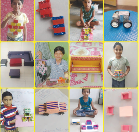
સર્જનાત્મક કૃતિઓ બનાવનાર વિદ્યાર્થીઓને તથા તેમના