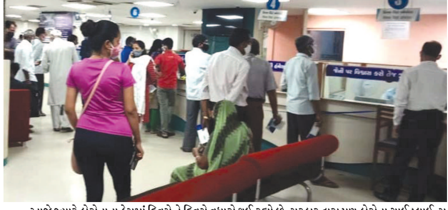
આજે જ્યારે કોરોનાના કેસમાં ટિવસે ને ટિવસે વધારો થઈ રહ્યો છે. સરકાર દ્વારા પણ કોરોના ગાર્ડઅઉન્સ આપવામાં આવી છે છતાં પણ આજે શહેરની સે. ૧૦ સ્થિત સ્ટેટ બેંક ઓફ ઈન્ડિયામાં સોશિયલ ડિસ્ટન્સીંગનો ભંગ થતો જોવા મળ્યો હતો.

વિદ્યાર્થીઓ માટે હયાત ફી લેવામાં આવે છે તે જ લેવાશે. રાજ્યમાં જીએમઈઆરએસ હસ્તકની સોલા, ગોંડી, ગાંધીનગર, વલસાડ, ધારપુર, હિંમતનગર, જુનાગઢ અને વડનગર મળી કુલ ૮ કોલેજો અને ૬ સરકારી મેડીકલ કોલેજ, સરકારી ૩-૨૮લ કોલેજ ૨ અને જી.એમ.ઈ.આર.એસ. હસ્તકની ૧ ૩-૨૮લ કોલેજમાં