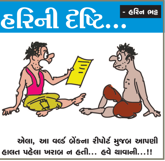
એલા, આ વર્લ્ડ ઍકના રીપોર્ટ મુજબ આપણી હાલત પહેલા ખરાબ ન હતી... હવે થાવાની...!!