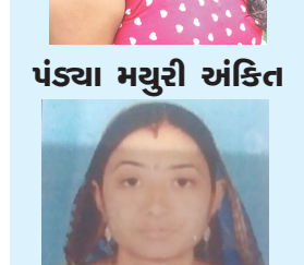
પંચ્યા મયુરી ચંકિત