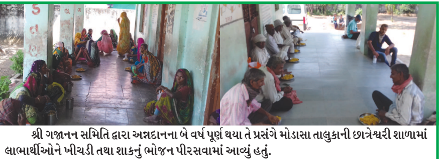
શ્રી જાગૃત સમિતિ દ્વારા અસ્ટદાનના બે વર્ષ પૂર્ણ થયા તે પ્રસંગે મોડાસા તાલુકાની છાત્રેશ્વરી શાળામાં લાભાર્થીઓને ખીચડી તથા શાકનું ભોજન પીરસવામાં આવ્યું હતું.

સમય દરમિયાન હિંમતનગરમાં ના ધારેલી જગ્યાએથી સાપ રેસ્ક્યુના ફોન મળ્યા, પક્ષીઓના પણ જંગલ અને વગડાથી રોડ ઠાઈવે શહેર નજીક મુવમેન્ટ અને નેસ્ટીંગ વધ્યા. હિંમતનગર, તા. ૯ (કાયબા) દ્વારા હેઅગ ડેસ્ટીનેશન બની ગયા. લોકડાઉનના કારણે અર્બન નેચરને ફીલીંગ મળી ગયું તેનું મેન્ટેનન્સ થઈ ગયું. લોકડાઉન વાઈલ્ડ લાઈફ માટે આશીર્વાદરૂપ સાબિત થયું.