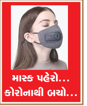
માસ્ક પહેરો... કોરોનાથી બચો...

જન્મદિને વધામણી વિભાગ અંતર્ગત કોઈપણ વાયક પોતાની તસવીરો પ્રકાશન માટે મોકલી શકે છે. પરંતુ, વાયકોને વિનંતી છે કે મોડમાં મોકી આ તસવીરો જન્મદિવસ દોચ તેના અગાઉના દિવસે એક વાચ્ય સુધીમાં અખબારને મળી જાય. વાયકો ઈચ્છે તો આ વિભાગમાં પ્રકાશન હેતુ પોતાની તસવીરો અગાઉથી પણ મોકલાવી શકે છે.