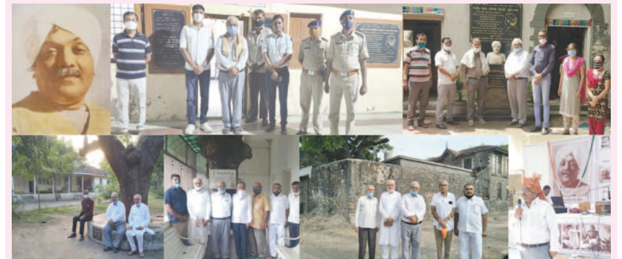
રાષ્ટ્રીય શાયર જવેરચંદ મેઘાણીની ૧૨૫મી જન્મજયંતી વર્ષની ઉજવણી નિમિત્તે જવેરચંદ મેઘાણીનાં જીવન-કાર્ય-સાહિત્યથી નવી પેઢી પરિચિત-પ્રેરિત થાય તે આશયથી પિનાકી મેઘાણી અને જવેરચંદ મેઘાણી સ્મૃતિ સંસ્થાનું પ્રેરક આયોજન કરવામાં આવ્યું હતું.