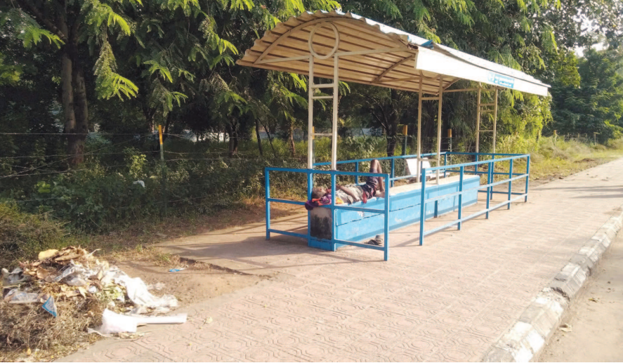
ગાંધીનગર રાજ્યનું પાટનગર હોવા છતાં અહીંની ગંદકી એ તંત્ર માટે માથાનો દુ:ખાવો છે. સાફ સફાઈ માટે લાખોનો ખર્ચ કરવામાં આવે છે. ઘર ઘરથી કચરો ઉઠાવવાની વાત હોય કે આંતરિક માર્ગોની સાફસફાઈનું કામ હોય તંત્ર દ્વારા દાવા મોટા મોટા કરવામાં આવે છે પરંતુ કચરો જ્યાં ત્યાં પડેલો જોવા મળે છે તે હકીકત છે. ચ-૩ સર્કલ પાસે પડેલો કચરાનો ઢગલો અહીંથી પસાર થતાં તંત્ર વાહકોને કદાચ દેખાતો નથી.

પણ તેઓને આશા છે કે તહેવારોમાં તે પણ થઈ જશે