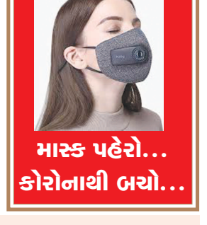
માસ્ક પહેરો... કોરોનાથી બચો...