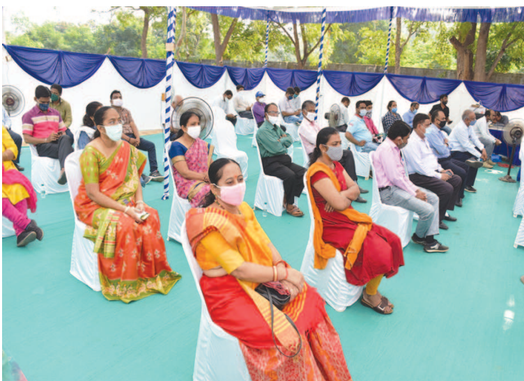
ગુણવત્તાની નોંધ લેવામાં આવી છે.

શિલાન્યાસ કર્યા બાદ શિક્ષણ મંત્રી ભૂપેન્દ્રસિંહ યુડાસમાએ જણાવ્યું હતું કે, શિક્ષણ ક્ષેત્રે ગુણવત્તા જળવાઈ રહે તેનું ઉમદા કાર્ય કરવાની જવાબદારી આપણા સૌની છે. ગુણવત્તા હશે, તો જ સમાજમાં સારા વ્યક્તિત્વનું ધડતર કરી શકીશું. સમગ્ર દેશમાં ગુજરાત રાજ્યમાં શિક્ષણ ક્ષેત્રે રહેલી