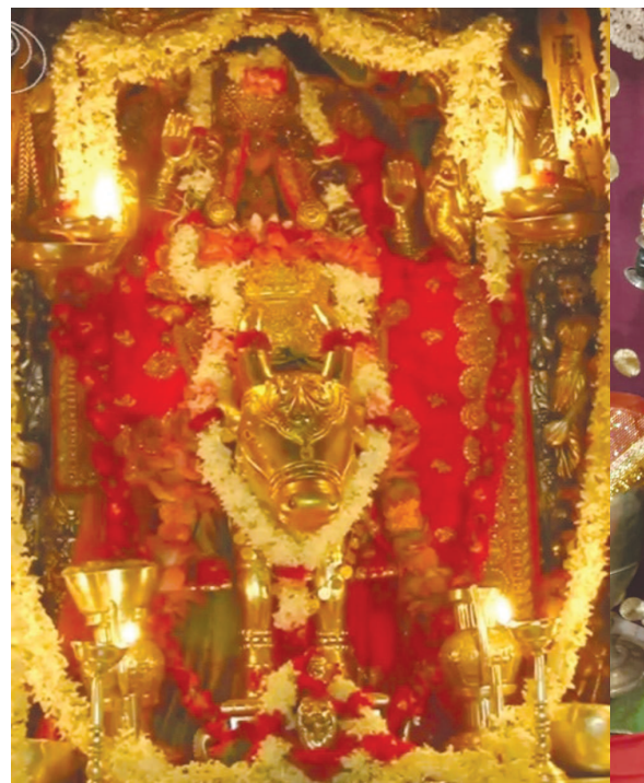
નવરાત્રિમાં ગરબા બંધ છે પરંતુ માતાજીનો શણગાર ખુબ જ ઉત્સાહથી કરાય છે. નવરાત્રિના ત્રીજા દિવસનો ખુબજ સુંદર શણગાર!! પ્રથમ તસવીર મોટા અંબાજી નંદી પર બિરાજમાન અંબે માના શ્રી યંત્રના દર્શન, બીજી તસવીર અમદાવાદના નગરદેવી ભદ્રકાળી માતાજીના પાર્વતી સ્વરૂપના અદભુત દરશન, છેલ્લી નંદી સ્વરૂપે બિરાજમાન માં બહુચરાજીનાં આસો સુદ ત્રીજ આજનાં દિવ્ય દર્શન! ભક્તો ઘેર બેઠા દર્શનનો લાભ લીધો હતો.