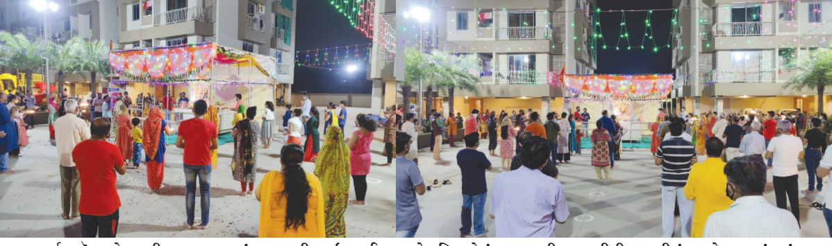
સાંઈક એરા સોસાયટી, સરગાસણમાં સરકારની ગાઈડલાઈનના દરેક નિયમોનું પાલન કરી નવરાત્રીની આરતીનું આયોજન થયું હતું.