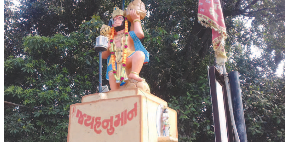
શ્રી ગજાનન સેવા સમિતિ દ્વારા હિંમતનગર શામળાજી રાષ્ટ્રીય ધોરી માર્ગને અડીને આવેલા વડવાળા હનુમાન મંદિરમાં નવરાત્રી પ્રસંગે એલઈડી ફોક્સ તથા મૂર્તિને ફુલહારથી સુશોભિત કરવામાં આવ્યું હતું.