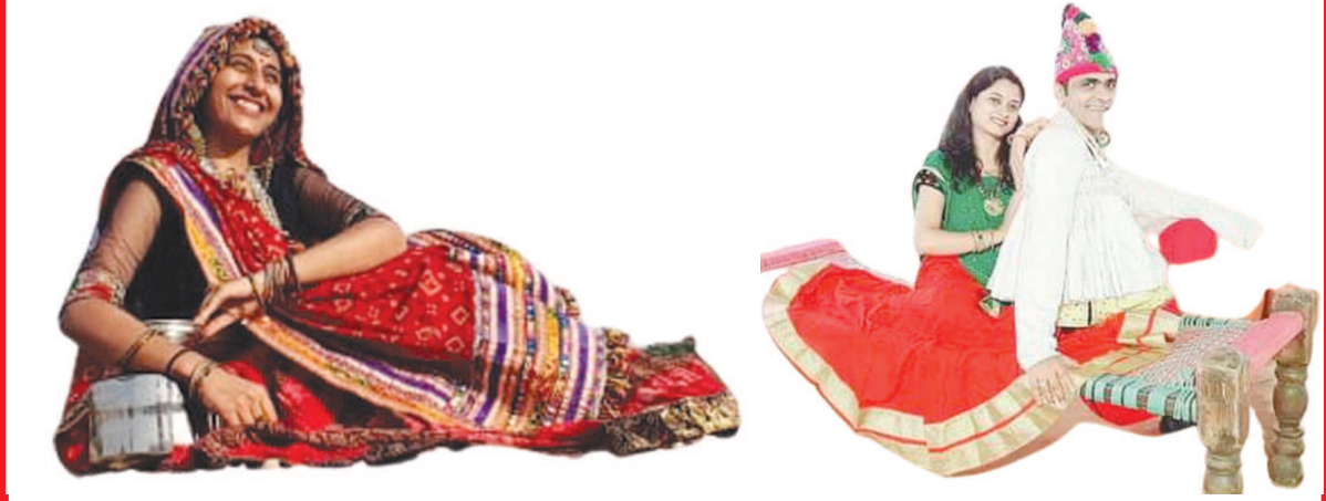
નવરાત્રીમાં જાહેર સ્થળોએ ગરબા થવાના નથી ત્યારે નગરના ખેલેયાઓએ ઘરે જ ટ્રેડીશનલ ડ્રેસમાં તૈયાર થઈ, સુપ બનાવી (સોશિયલ મિડિયાના માધ્યમથી) મિત્રો સાથે ઓનલાઈન ગરબા રમીને નવરાત્રીનો આનંદ માણ્યો હતો.