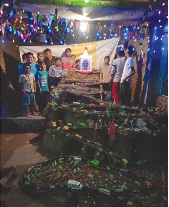
નવરાત્રી મહોત્સવમાં ચિલોડા મોટા ટીંબાવાળા વાસના પ્રવેશદ્વારે નાના ભૂલકાંઓ દ્વારા સર્જિત કલાત્મક માતાજીનો ગબ્બરે ભારે આકર્ષણ જમાવ્યું હતું.