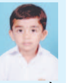
ભાગ્ય સુહાગ વોરા