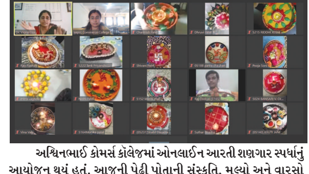
અધિનભાઈ કોમર્સ કોલેજમાં ઓનલાઈન આરતી શણગાર સ્પર્ધાનું આયોજન થયું હતું. આજની પેઢી પોતાની સંસ્કૃતિ, મૂલ્યો અને વારસો જાળવી રાખે અને તહેવારોના ભાવ સમજી શકે એવા આશયથી સ્પર્ધા યોજાઈ હતી.