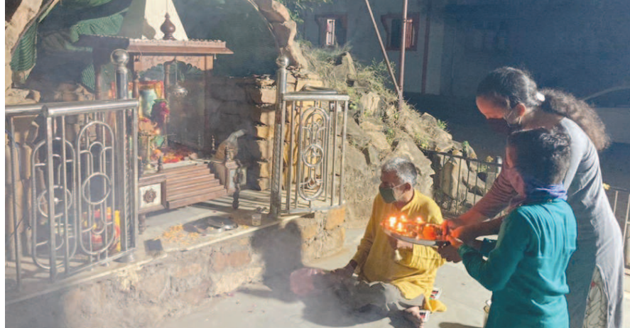
સેક્ટર-૩માં નવરાત્રી નિમિત્તે માતાજીની આરતી અને પૂજા સોશિયલ ડિસ્ટન્સીંગ સાથે કરવામાં આવી રહ્યા છે.