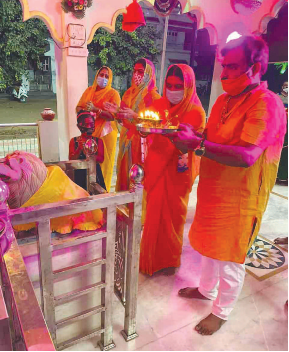
સેક્ટર-૫ મહાકાલી મંદિર ખાતે નવરાત્રી નિમિત્તે આરતીનું આયોજન કરવામાં આવી રહ્યું છે. આસપાસના રહીશો અને ભાવિકો સોશિયલ ડિસ્ટન્સીંગ સાથે આરતીનો લાભ લે છે.