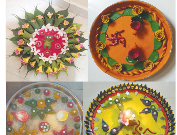
અધિનભાઈ કોમર્સ કોલેજમાં ઓનલાઈન આરતી શણગાર સ્પર્ધાનું આયોજન થયું હતું. આજની પેઢી પોતાની સંસ્કૃતિ, મૂલ્યો અને વારસો જાળવી રાખે અને તહેવારોના ભાવ સમજી શકે એવા આશયથી સ્પર્ધા યોજાઈ હતી.