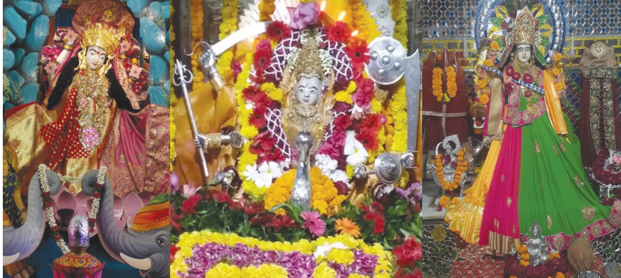
નવરાત્રી મહોત્સવ દરમિયાન અમદાવાદના વિવિધ વિસ્તારોમાં માતાજીની આરતી તથા સુંદર રીતે શણગાર કરવામાં આવ્યો હતો. અંબાજી માતાજી, ચાંદની ચોક, નારણપુરા, સોલારોડ, ઉમિયા માતાજી-ઉડા, અંબાજી માતાજી- માધુપુરા, અમદાવાદ ખાતે દેશમાન થાય છે.