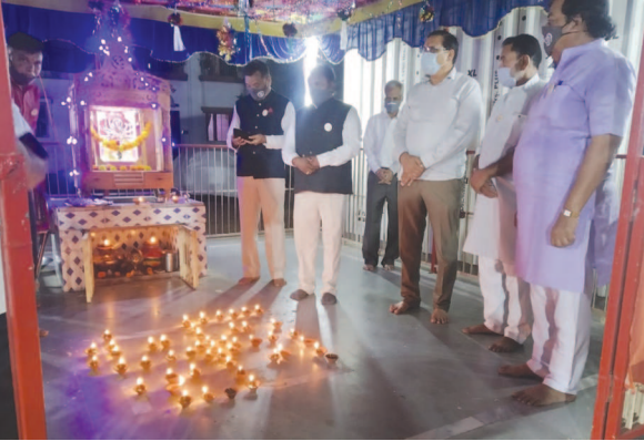
ઈન્ડિયન લાયન્સ સ્વસ્થિમ ગાંધીનગર પરિવાર તરફથી 'કોરોના ભગવો' કાર્યક્રમ અંતર્ગત માતાજીની આરતી દ્વારા 'જન જાગૃતિ અભિયાન આરતી' કરી સેક્ટર-૧ ૨ માં સરસ રીતે કાર્યક્રમ સંપન્ન થયો હતો.