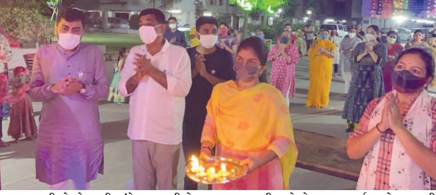
કાસારીઓ સોસાયટી, રાંદેસણના રહીશો દ્વારા માતાજીના ત્રીજા નોરતે ખૂબ શ્રદ્ધાપૂર્વક અને સરકારની ગાઈડલાઈન મુજબ આયોજન કરવામાં આવ્યું હતું, જેમાં અતિથિ તરીકે ગાંધીનગરના મેયર રીટાબેન પટેલ પધાર્યા હતા.