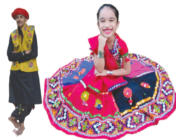
નવરાત્રીનો તહેવાર નાના-મોટા તમામ માટે શોભ પ્રદર્શિત કરવાનો તહેવાર છે. ત્યારે નગરના ભૂલકાઓ પણ ઘરે સરસ મજાની ચણિયાઓ લી કે કેડીયું પહેરી તેવાર થઈને નવરાત્રીને વધાવી રહ્યા છે.