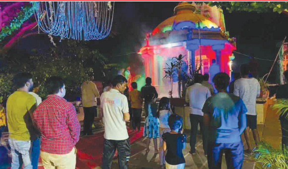
શાહપુર ખાતે મહાકાલી માતાના મંદિર ખાતે આરતી અને પૂજા કરવામાં આવી હતી.