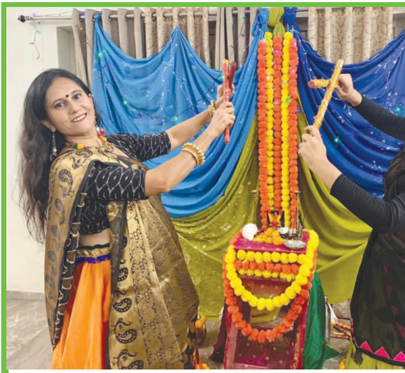
પૂજન ડાન્સ એકેડમી ખાતે નવ દિવસ માતાજીની સ્થાપના તથા એકાંતરે ઘરમાં ગરબાનું આયોજન કરવામાં આવી રહ્યું છે જેમાં એકેડમીના સદસ્યો નાના-નાના ગ્રુપમાં ભાગ લઈ રહ્યા છે.