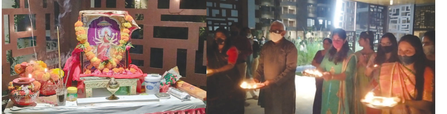
હરિઆલય કોમ્પલેક્ષ ખાતે માતાજીની આરતી અને પૂજા સરકારની ગાઈડલાઈન મુજબ કરવામાં આવી હતી. કોમ્પલેક્ષના વસાહતીઓ દ્વારા સોશિયલ ડિસ્ટન્સીંગનું પણ ધ્યાન રાખવામાં આવ્યું હતું.