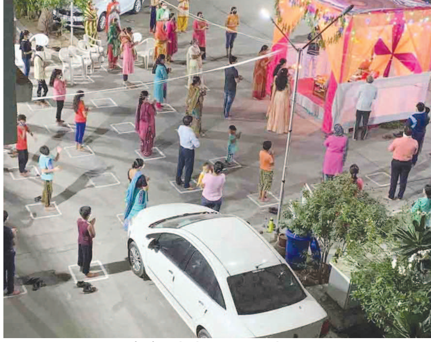
નવરાત્રીની ઉજવણી સાદાઈ થઈ રહી છે. સોશિયલ ડિસ્ટન્સ સાથે માતાજીની આરતી કરવામાં આવી રહી છે. મંદિરોને રોશનીથી શણગારવામાં આવ્યા છે. કુડાસણ પાટીયા પાસે જય યોગેશ્વર કોમ્પલેક્ષ ખાતે સોશિયલ ડિસ્ટન્સીંગ સાથે માતાજીની આરતી કરવામાં આવે છે.