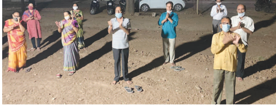
સેક્ટર-૩માં નવરાત્રી નિમિત્તે માતાજીની આરતી અને પૂજા સોશિયલ ડિસ્ટન્સીંગ સાથે કરવામાં આવી રહ્યા છે.