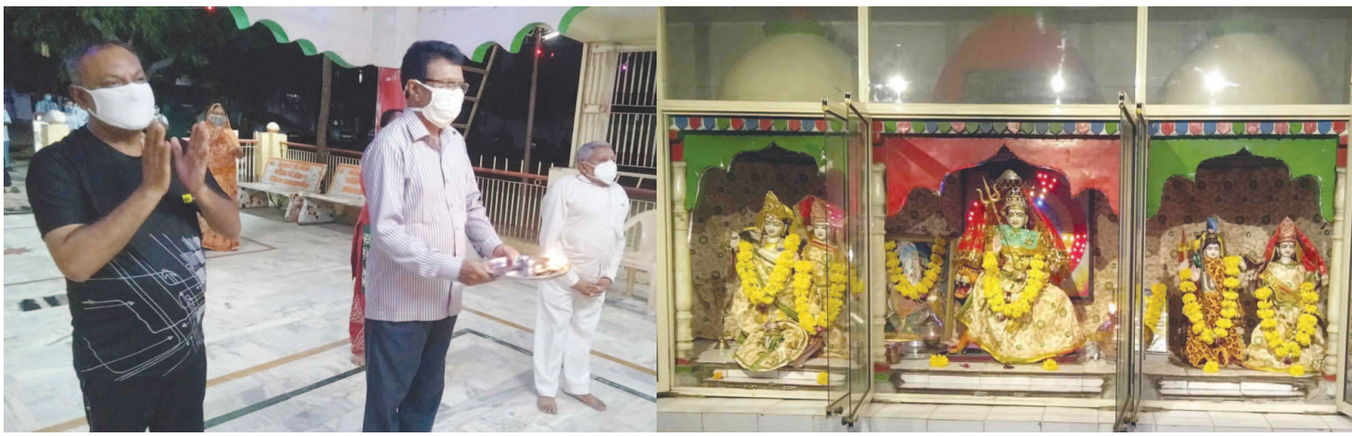
સેક્ટર-૩ સી શિવશક્તિ અંબાજી મંદિર ખાતે નવરાત્રીની સાદાઈથી ઉજવણી થઈ રહી છે. વસાહતી બાઈ-બહેનો એકત્ર થઈ દરરોજ માની આરતી કરી રહ્યા છે અને સૌ સારાવાના થાય એવી પ્રાર્થના કરી રહ્યા છે.