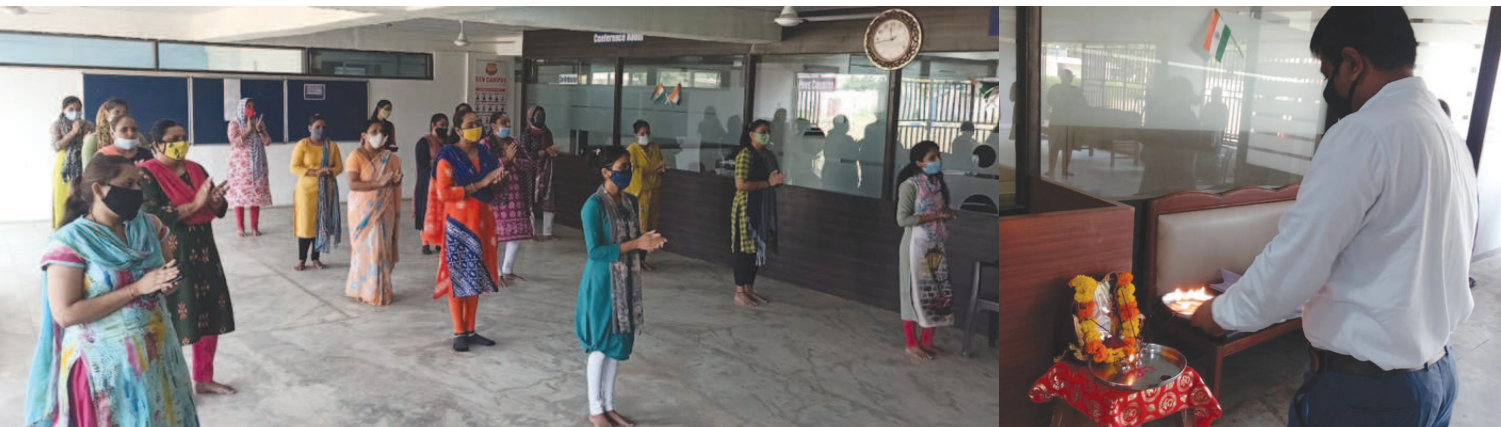
એસ એસ વી કેમ્પસમાં કોવિડ-૧૯ ની ગાઈડલાઈન્સને ધ્યાનમાં રાખી માસ્ક, શોશિયલ ડિસ્ટન્સિંગ ધ્યાન રાખી શિક્ષકો, પ્રિન્સીપાલ અને ટ્રસ્ટીગણે ભાગ લીધો હતો. જેની સાથે સાથે પ્રિન્સીપાલ, દરેક શિક્ષકગણ અને એડમીન દ્વારા કોવીડ-૧૯ ને હરાવવા માટે ગાઈડલાઈન્સ મુજબ સમયાન્તરે હાથ ધોવા, માસ્ક પહેરવા, સોશિયલ ડિસ્ટન્સિંગ પાલન અને પોતે કોવીડ-૧૯ થી બચવા માટે શપથ ગ્રહણ કરી હતી.