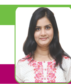
લવ યુ જિંદગી

સ્કૂલના દિવસોમાં તો ખાસ એના માટે જ થઈને ટ્યુશન રખાવું પડેલું. જેમ તેમ કરીને એ પડાવ પાર કરી ગયેલા. મેં તો સોગંધ ખાધેલી કે એકવાર આ ગણિતથી કેડો છૂટે પછી જિંદગીમાં ફરી ક્યારેય એનું નામ