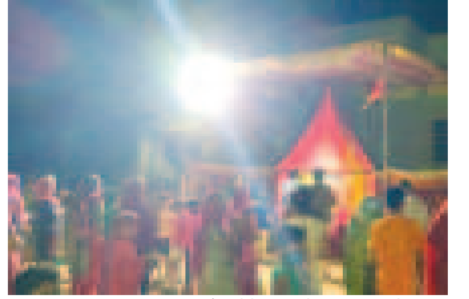
કુડાસણ ગામમાં માતાજીની માંડવીની માઈ ભક્તોએ આરતી અને પૂજા કરી હતી. સાથે સરકારની ગાઈડલાઈન્સનું પણ પાલન કર્યું હતું.