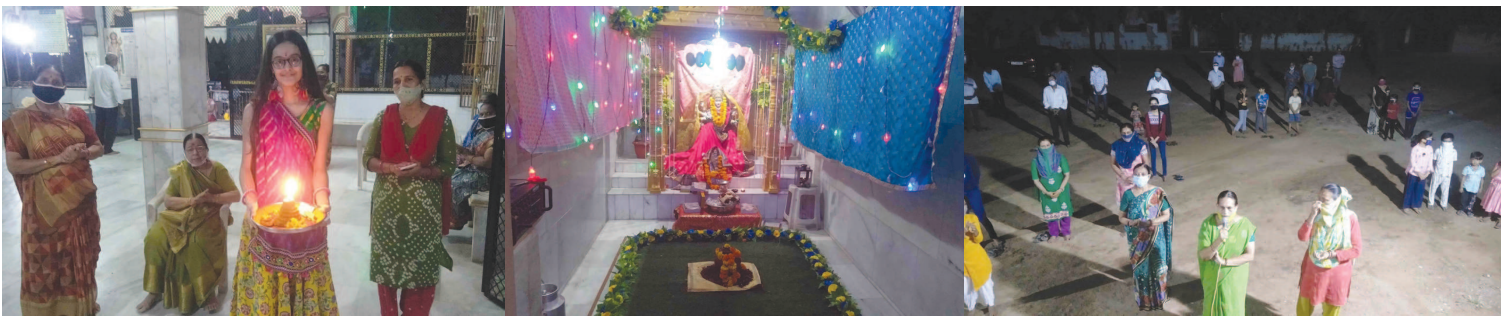
સેક્ટર-૫એ શિવશક્તિ મંદિર ખાતે મોટી સંખ્યામાં ભાવિક ભક્તોએ આરતીનો લ્હાવો લીધો હતો. સોશિયલ ડિસ્ટન્સીંગ સાથે વસાહતીઓ આરતીમાં જોડાયા હતા.