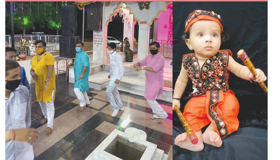
ખેલેયાઓ રમ્યા વગર નવરાત્રી મનાવતા નથી. આજે આરતી બાદ માના નામનો પાંચ રાઉન્ડ ગરબે ગુરુયા સરકારના નિયમોનું ચુસ્ત પાલન કર્યું હતું.

વરસો પહેલાં ગણિતના શિક્ષક કર્તક નવું શીખવતા અને અમે લોકો માથું ખંજવાળતા એકબીજા સામે જોઈ રહેતા. માથામાં જૂ ન હતી પડી, પણ ભારેભરમ એવા શબ્દ જોઈને અમારા માથામાંથી પરસેવો છૂટતો અને એ રેલો રગડતો રગડતો જેમ આગળ વધે એમ એમ એટલા ભાગમાં ખંજવાળ આવી જતી.