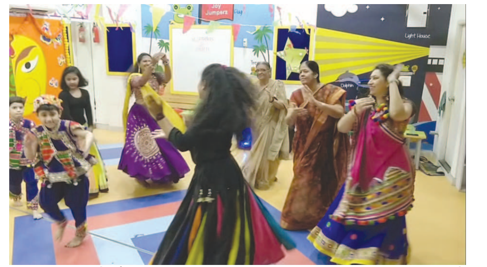
ગાંધીનગરના ધોડાઈ પરિવાર દ્વારા પારિવારિક ગરબા રમી નવરાત્રીની ઉજવણી કરવામાં આવી હતી. તે તસ્વીરમાં દર્શનમાં થાય છે...