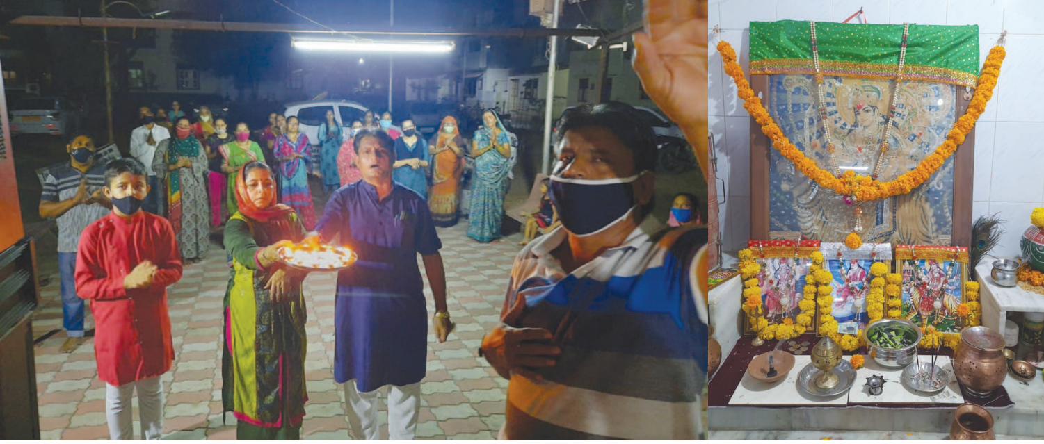
નવરાત્રીના ચોથા દિવસે સેક્ટર-૧ ઉબી, શ્રી અંબાજી મંદિર, પારીજાત/વનલક્ષ્મી એપાર્ટમેન્ટ ખાતે નગરજનોએ આરતી અને માતાજીના દર્શનનો લાભ લીધો હતો.