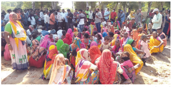
વિચારણા છે. રેલવે સ્ટેશન પાછળથી મોટી સંખ્યામાં ઝુંપડાના દબાણો દુર

દાયકાઓ બાદ પણ ૨ હજાર શ્રમિકોને ઉપર ખુલ્લા આકાશ નીચે રડડતા મુકી દેવાયા છે અલબત્ત ગુજરાતમાં સૌનો સાથ અને વિકાસ નથી બંધારણનુ રાજ ખતમ થયું છે. ત્યારે આગામી દિવસોમાં આંદોલનની રાહ પણ લડત આપવા તૈયાર છીએ. આગામી દિવસોમાં ગુજરાત હાઈકોર્ટના દ્વાર પણ ખટકાવીશુ. મુખ્યમંત્રીએ પણ આ શ્રમિકોને મળીને તેમની વેદના સમજવી જોઈએ. સૌનો સાથ સૌનો વિકાસ તેવો દાવો કરવો એ માત્ર ખોટો દંભ છે.