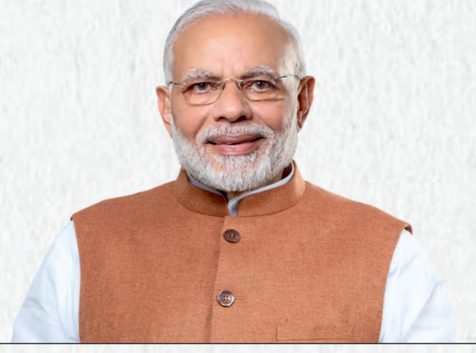
શ્રી નરેન્દ્રભાઈ મોદી પ્રધાનમંત્રી, ભારત