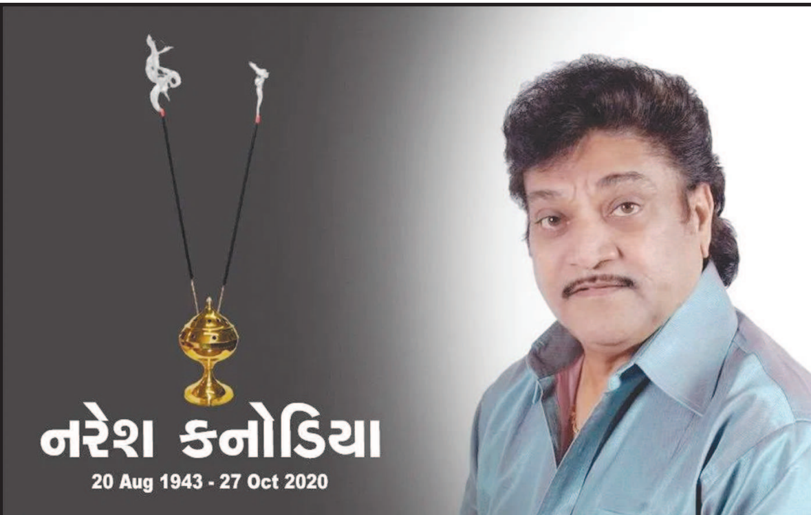
નરેશ કનોડિયા 20 Aug 1943 - 27 Oct 2020

નરેશ કનોડિયાએ એક ઈ-ટરવ્યુમાં જણાવ્યું હતું કે, "અમે ભલે અલગ-અલગ સમયે જન્મા લોઈએ પણ અમે એકબીજાથી એટલા જોડાયેલા છીએ કે જો મહેશભાઈને શરદી થાય તો મને પણ થાય. એમનું ગુણું ખરાબ થાય તો મારું પણ ગુણું ખરાબ થાય. અમે ક્યારેય અલગ રહી જ ન શકીએ. નરેશ કનોડિયાના ઈ-ટરવ્યુ મુજબ જ તેઓએ પણ તેમના મોટાભાઈના નિધનના ત્રીજા જ દિવસે આ દુનિયામાંથી વિદાય લીધી છે. અને ઉલ્લેખનીય છે કે, સોશિયલ મીડિયાના જમાનામાં થોડા દિવસો પહેલાં મહેશ કનોડિયા અને નરેશ કનોડિયાનો એકસાથે ગીત ગાતા હોય તેવો વીડિયો વાયરલ થયો હતો. બંન્ને ભાઈઓ 'તેરે બિના ભી ક્યા જીના' ગીત સાથે ગાયું હતું. ગત રવિવારે જ મહેશ કનોડિયાનું નિધન થયું હતું. અને તેમના નાના ભાઈ નરેશ કનોડિયાનું અમદાવાદની યુ એન મહેતામાં કોરોનાની સારવાર દરમિયાન આજે નિધન થયું છે.